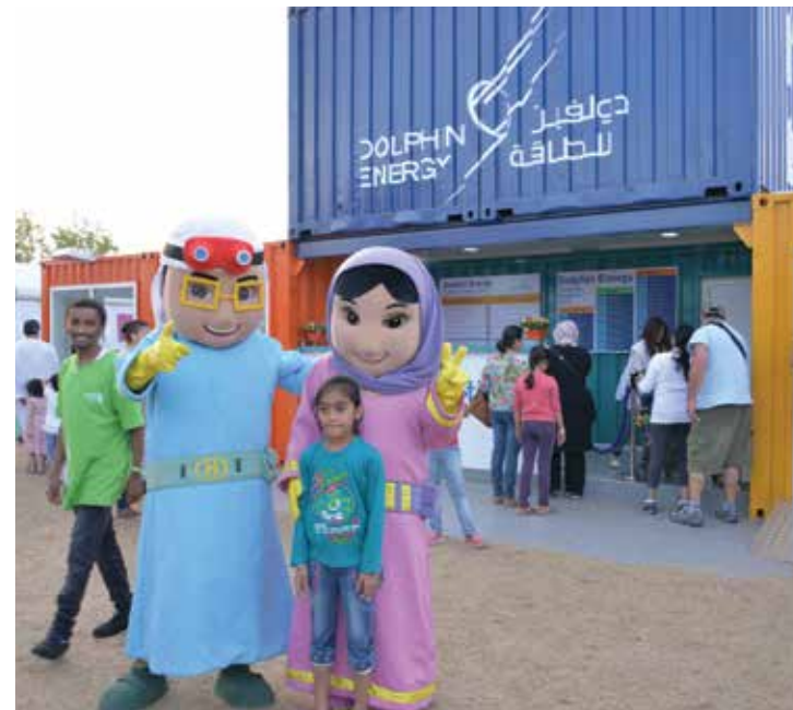
شخصيات مهرجان أبوظبي للعلوم المفضلة لدى الأولاد تزور جناح دولفين للطاقة المحدودة

أقيم مهرجان أبوظبي للعلوم، الذي يزداد نمواً ومقدرة على لغت الأنتظار مع كل دورة، ما بين ١٢ و ٢٢ نوفمبر ٢٠١٥، برعاية دولفين للطاقة المحدودة التي افتخر باحتضانها مناسبة كهذه، وقد سجّلت الشركة حضورها من خلال جناح أنشئ خصيصاً لهذا الغرض في حديقة مشرف المركزية في أبوظبي، والذي جذب المئات من الزوار والعائلات على امتداد أيام المهرجان الأحد عشر.