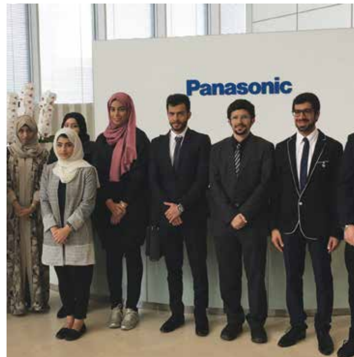
محمد يزور المركز الرئيس لباناسونيك برفقة فريق القادة الشباب لطاقة المستقبل

وينظم معهد مصدر للعلوم والتكنولوجيا برنامج «القادة الواعدين لطاقة المستقبل» بهدف استقطاب الشباب اللامعين والموهوبين من الإمارات العربية المتحدة، وإعدادهم وتمكينهم ليكونوا قادة الغد في مجالات الطاقة المتقدمة والتقنيات المستدامة. وساهمت رحلة الطلبة واحتكاكهم مع قادة اليوم في تبادل الأفكار والخبرات حول مستقبل الطاقة، وحلول التغير المناخي، وأمن الطاقة، وقضايا الاستدامة.