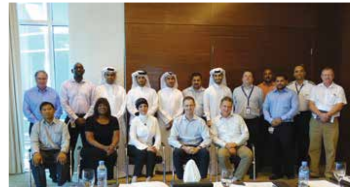
فريق العمليات البحرية يحتفل بثمان سنوات من العمل المتواصل دون أي تغيب ناجم عن إصابة عمل

ضمن جهود الشركة لتحسين مستويات الصحة والعافية بين موظفيها، نُشرت معلومات توعوية عن الطعام والغذاء على جميع موظفي الشركة، وشملت تلك المعلومات تفاصيل عن تأثير أصناف الطعام على المزاج والذاكرة والقدرة على التركيز.