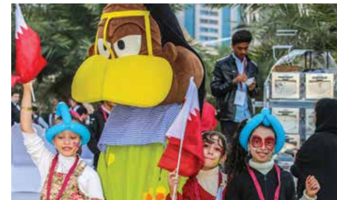
أطفال موظفي دولفين للطاقة يمرحون مع شخصيات كرتونية محبوبة بمناسبة اليوم العائلي واليوم الوطني لدولة قطر