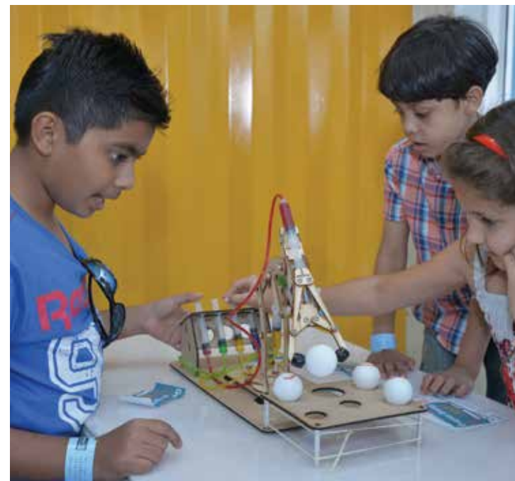
الأولاد يتناقشون لحل مسألة علمية

وتابع: «إنّ تسليط الضوء على أهمية العلوم، التكنولوجيا، الهندسة والرياضيات، هي طريقة عظيمة لتعزيز فهمها وتشجيع الفتية على اختيار مسيرة مهنية ضمنها في المستقبل. ونحن فخورون بمشاركتنا في هذه المبادرة الرائعة، كما سررنا لما لمسناه من استجابة لبرنامجنا الخاص بالرعاية والنشاطات».