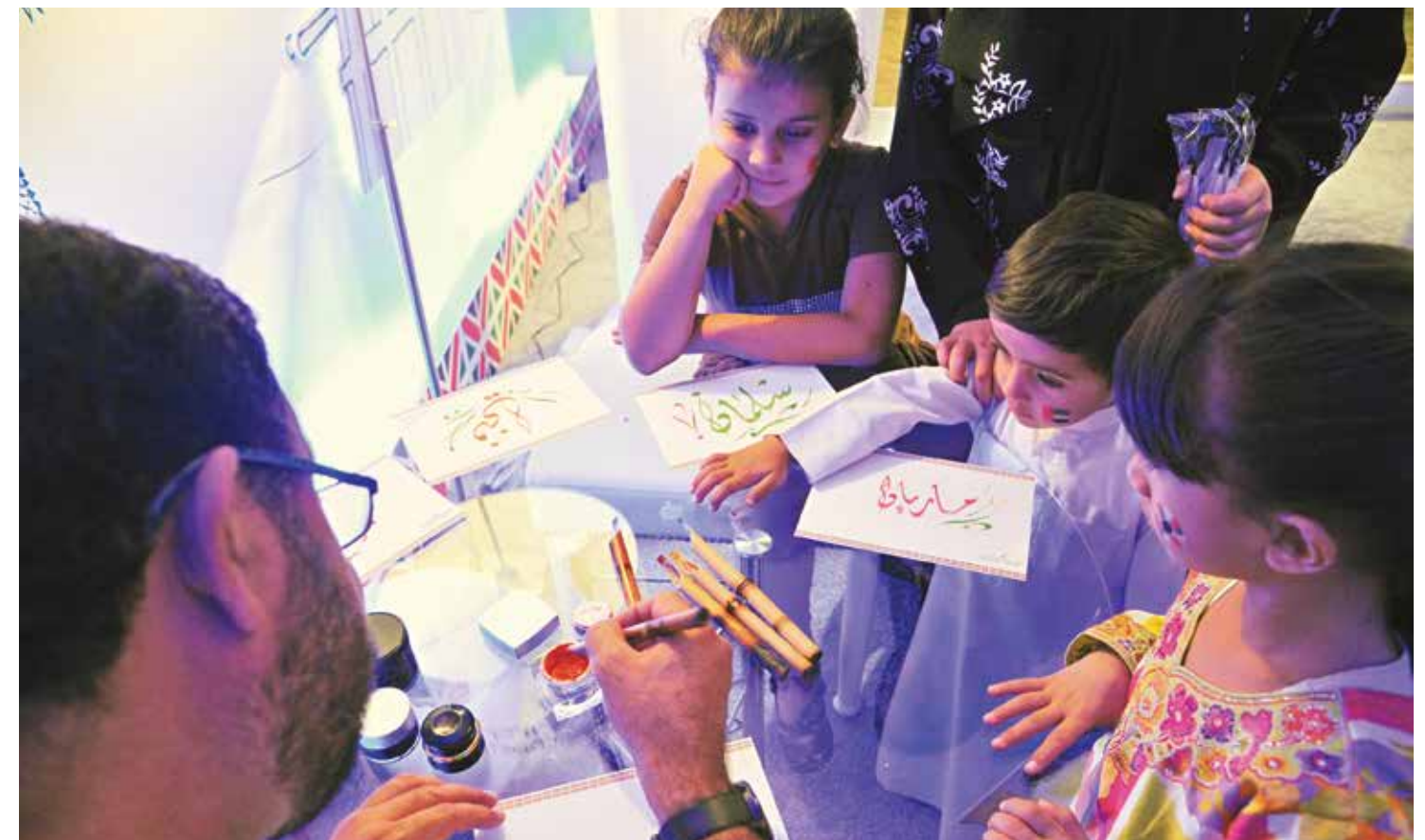
الأولاد يشاركون في ورشة عمل فن الخط العربي

أما مشاركة دولفين للطاقة المحدودة، فشملت إقامة خيمة للأطفال نُظمت فيها النشاطات المسلية والممتعة التي تدرج ضمن إطار العيد الوطني. ومن هذه النشاطات طلاء الوجوه، والتزيين بالحنة، وصنع الأشغال اليدوية، وتقديم الهدايا للأطفال. وتعتبر مشاركة الشركة مهمة للغاية لتأكيد التزام روح الاتحاد والاحتفال بهذه المناسبة المميزة مع المواطنين والوافدين.