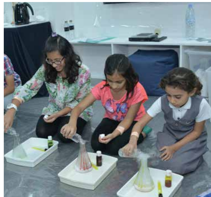
تركيز محكم خلال العرض العلمي

كجزء من جهود الشركة لدعم القضايا النبيلة والإنسانية، خصّصت دولفين للطاقة المحدودة في قطر رصيد مالي لنشاطات الرعاية في الربع الرابع من العام ٢٠١٥.