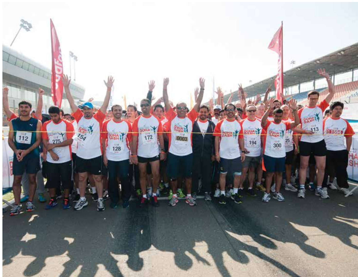
عداؤون متحمسون يستعدون للبدء بسباق الدوحة للمسافات القصيرة

يهدف اليوم الوطني للرياضة في دولة قطر إلى تشجيع السكان على المشاركة في الأنشطة الرياضية واختيار نمط حياة أكثر نشاطاً من الناحية البدنية. وفي العام ٢٠١٤، حقق سباق دولفين للطاقة المحدودة في الدوحة للمسافات القصيرة نجاحاً كبيراً بمشاركة أكثر من ألفي شخص في أربع