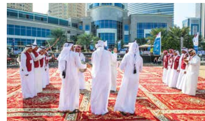
فرقة قطرية تقدم العرضة القطرية احتفالاً باليوم الوطني