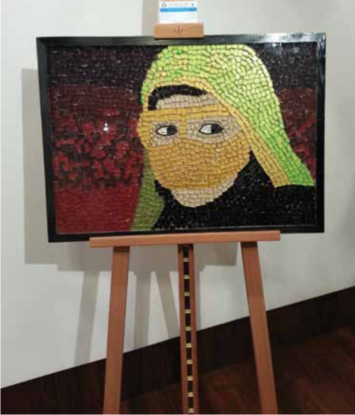
لوحة موزايك من أعمال نورة في معرض سوق واقف ٢٠١٣

خلال أوقات فراغي، أحب قراءة الروايات، وإعداد المعجنات. كما أحب الرسم، وكثيراً ما أحضر ورش عمل فنية لتحسين مهاراتي في الرسم. وقد كنت ممتنة للحصول على فرصة لعرض أعمال الفنية في مركز المعارض الفنية في سوق واقف.