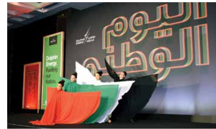
عرضاً راقصاً بأشرطة قماشية حملت ألوان العلم الإماراتي

بعد ذلك، دُعي جميع أفراد الدفعة الأولى من موظفي دولفين للطاقة المحدودة، ممن تقدّموا للمشاركة في الخدمة الوطنية، إلى المسرح حيث تم تكريمهم.