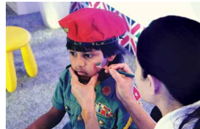
تلوين على الوجه بمناسبة العيد الوطني

وتخلل الدورة السنوية السادسة للمهرجان الجماهيري سلسلة من المناسبات الرامية إلى الاحتفاء بالإرث الذي خلفه الأب المؤسس، الشيخ زايد بن سلطان آل نهيان طيب الله ثراه. أقيم المهرجان بين ١٩ نوفمبر و١٢ ديسمبر، وقدم مجموعة متنوعة من النشاطات الممتعة، كالمعرض التقليدي لعادات الإمارات وتقاليدها، وورش عمل حرفية تفاعلية، ومسابقات لرياضة الصقارة، وسوق فريدة عالمية، وفنون فولكلورية إماراتية.