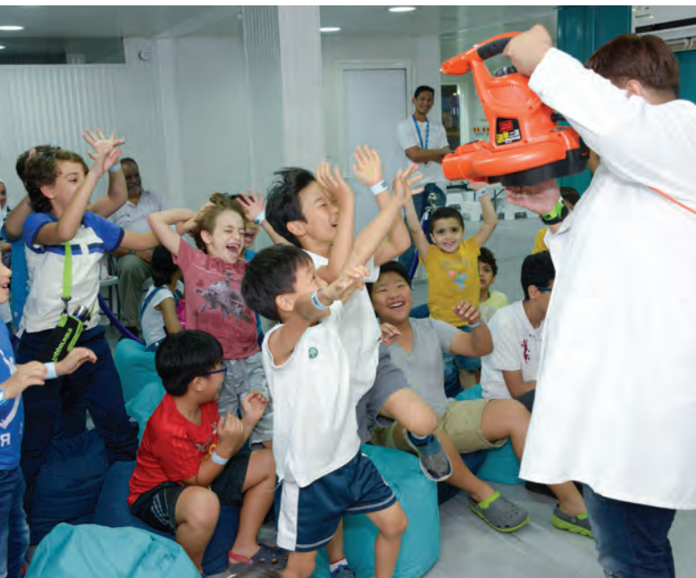
لافت العروض إقبالاً كبيراً وبلت روح الإلهام في نفوس الصغار