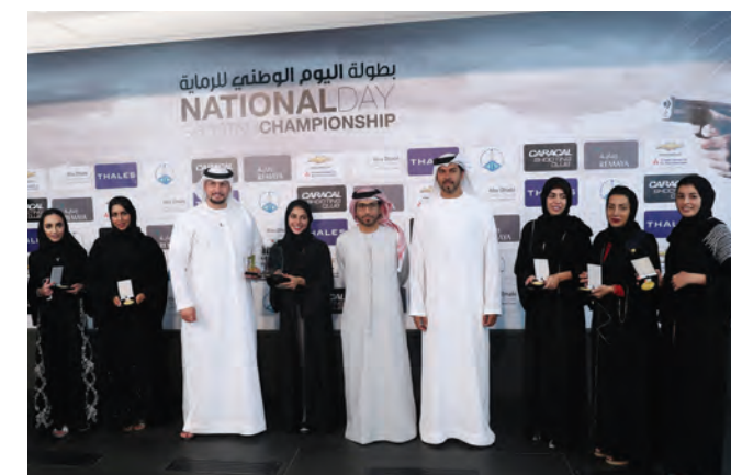
فريق سيدات دولفين للطاقة المحدودة يتسلم جائزة المركز الأول