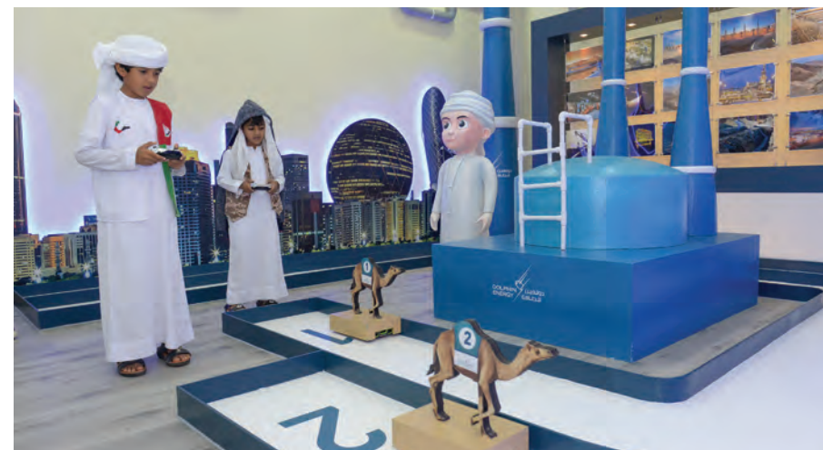
لعبة سباق الهجن لافتت استنساناً كبيراً من الصغار