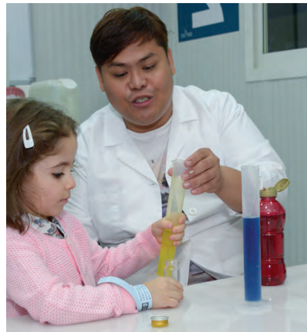
أحد زوارنا الصغار يستكشف السوائل المختلفة في مختبر الماء