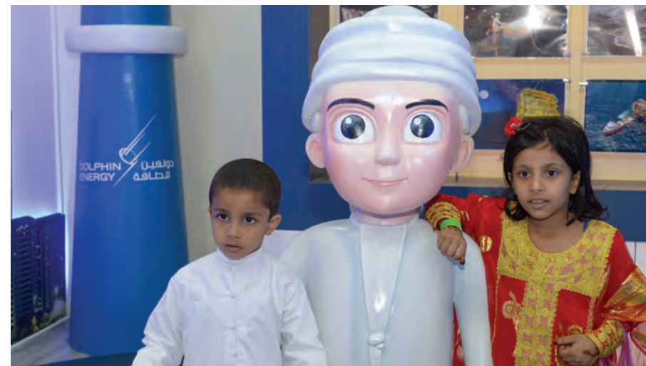
وارنا الصغار يلتقطون صورة تذكارية في خيمة دولفين للطاقة المحدودة للأنشطة

"فهم الصعوبات التي واجهها أجدادنا في أرض الإمارات يجعلنا ندرك أهمية ما وصلنا إليه اليوم"