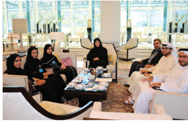
ممثلون عن دولفين للطاقة المحدودة مع بعض عملائنا

نائب رئيس أول إدارة التسويق والشؤون التجارية