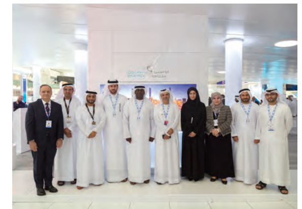
موظفون من إدارة التسويق والشؤون التجارية يلتقون بالعملاء في إطار مبادرة "الملتقى"