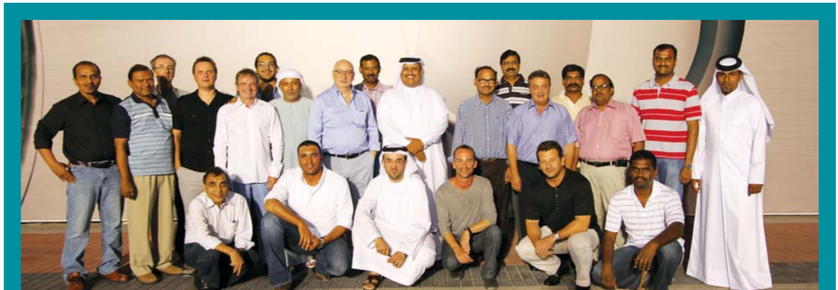
فريق قسم المشاريع في دولفين للطاقة بدولة قطر