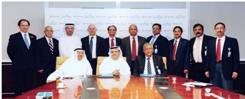
صورة تجمع عدد من أعضاء الإدارة العليا في دولفين للطاقة وشركة لارسن وتوبرو لإنشاءات الهندسية

بموجب العقد، ستقوم شركة لارسن وتيربو بجميع أعمال الهندسة والتوريد والإنشاء الضرورية لتنفيذ عملية تركيب ثلاثة محركات ضغط غازية من طراز رولز رويس تبلغ طاقة كل منها ٥٢ ميغاواط، بالإضافة إلى تنفيذ أعمال أخرى متعلقة بالمنشآت. وكانت شركة دولفين للطاقة قد أعلنت في أبريل الماضي عن تعاقدها مع شركة رولز رويس بقيمة ١٣٦ مليون دولار.