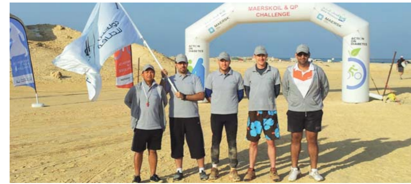
فريق دولفين للطاقة المشارك في المسابقة

وقد جرت وقائع المنافسة على أربع مراحل استغرقت يومين (١٧ و ١٨ نوفمبر) ضمن ظروف صعبة تضمنت عدة مهمات صعبة منها وضع كل فريق في مكان مجهول في الصحراء والطلب منهم تحديد موقعهم وطريق الخروج باستخدام نظام تحديد الموقع العالمي