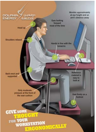
من الضروري الانتباه لوضعية جلوسك في المكتب