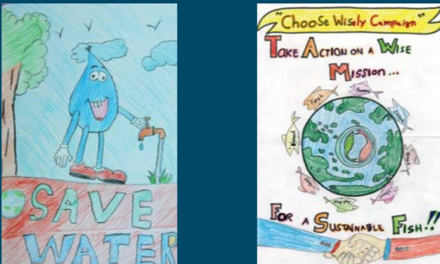
نيكول ديسيلفاو (ابنة كريستابل ديسيلفا) وجاد حنا (ابن كاتيا صدقتي) الفائزان بجائزة المسابقة الفنية