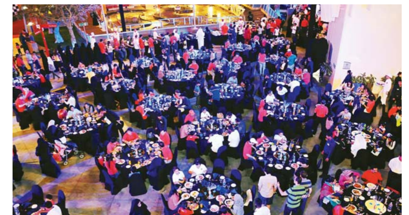
Dolphin Energy staff come together for dinner after a long day of activities and fun rides

included F1 Abu Dhabi Grand Prix tickets, gift certificates to the mall, iPad's, dinner and hotel vouchers as well as Etihad Airways flight vouchers. An amazing performance took place after the raffle combining gymnastics with theatrics, that left everyone mesmerized and excited for the rest of the evening. A large buffet dinner followed featuring a variety of international dishes before the park was closed to outside guests and Dolphin Energy employees had the theme park to themselves including the one of the world's fastest roller coasters, Formula Rossa – zero to 240 km/h in less than five seconds. Everyone agreed it was a night to remember! ■