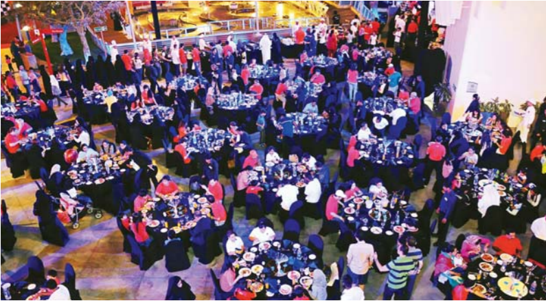
موظفو دولفين للطاقة مع أفراد عائلاتهم في أبوظبي يستمعون بفعاليات اليوم العائلي المبهر