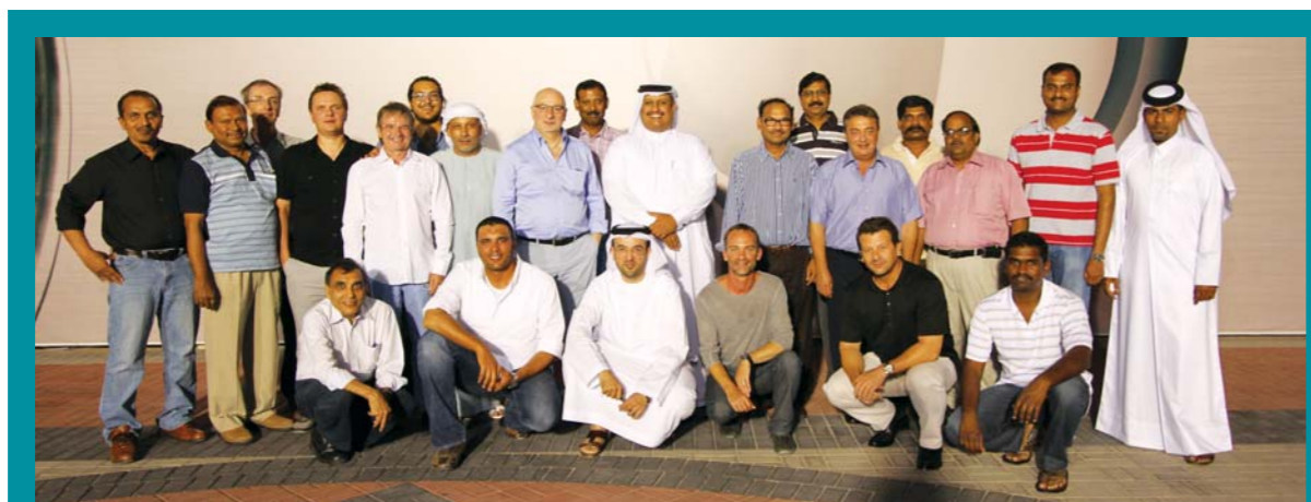
Dolphin Energy Projects Team in Qatar