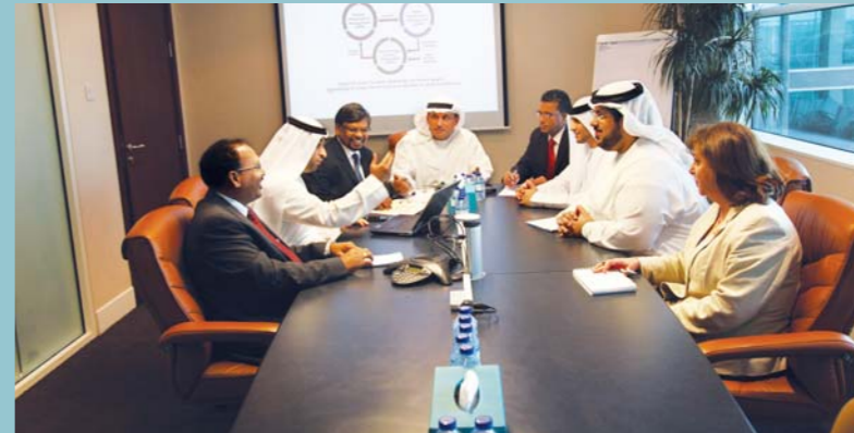
فريق التشغيل الآلي المؤسسي

يقدم القسم الخدمات المؤسسية لعمليات قطر والخدمات الفنية بالإمارات والمشاريع من خلال توفير خبراء على درجة عالية من الخبرة والمهارة قادرين على تقديم خدمات الدعم