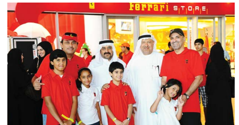
Children and adults both enjoyed the event