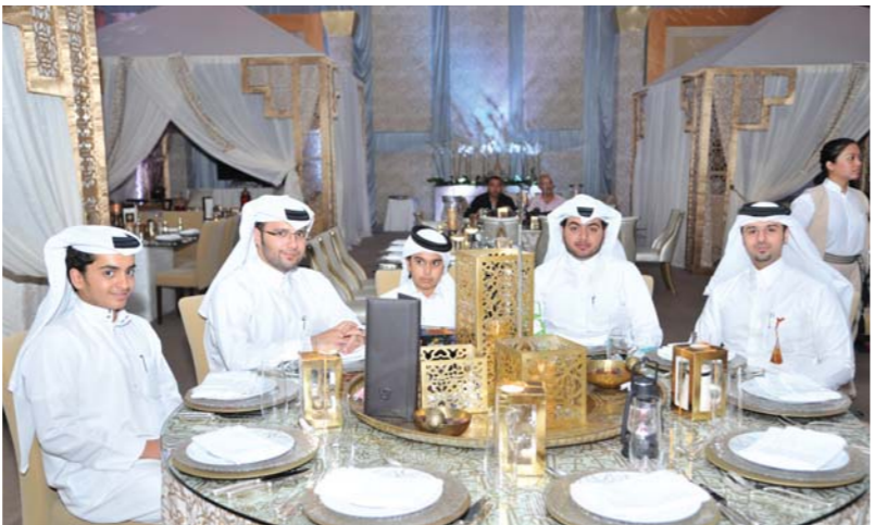
موظفو دولفين للطاقة يحتفلون بغبقة رمضانبة مميزة في قطر