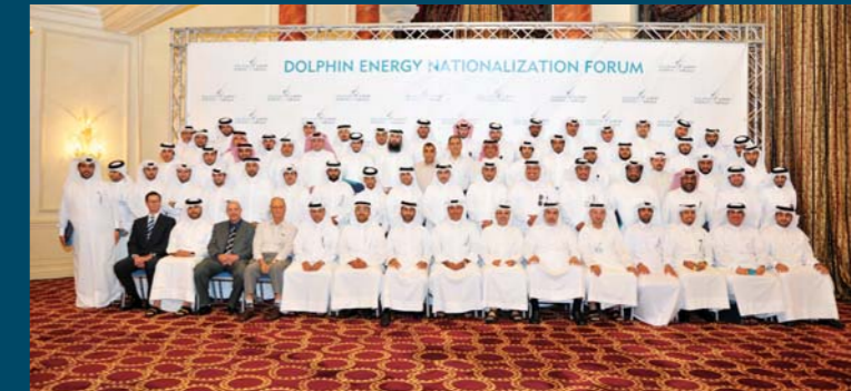
صورة جماعية للمشاركين في منتدى التوظين السنوي لدولفين للطاقة بدولة قطر

وجرى خلال المنتدى توزيع الجوائز التقديرية على عدد من الموظفين القطريين نتيجة لأدائهم المتميز في عملهم خلال السنة الماضية، كما