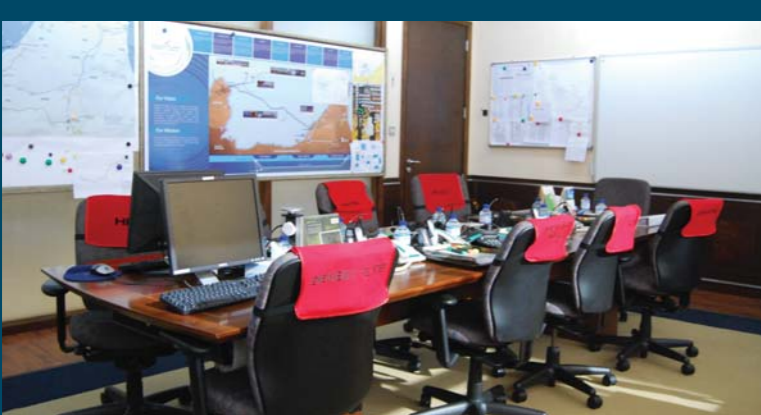
مركز إدارة الطوارئ في دولفين للطاقة مستعد دائماً للتعامل مع أي موقف

وبخصوص خطتها لسنة ٢٠١٣، تنوي إدارة الجودة والصحة والسلامة والبيئة والأمن التركيز على تحديث خطط الكوارث والطوارئ وزيادة متطلباتها، وإجراء المزيد من التمارين المحلية والدورات التدريبية لتذكير كل الموظفين الإدارة في هذا المجال على ضرورة توفير التدريب اللازم لجميع موظفي الشركة وفقاً لأحدث إجراءات الطوارئ. ■