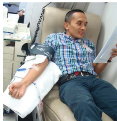
60 Dolphin Energy employees participated in the blood donation drive