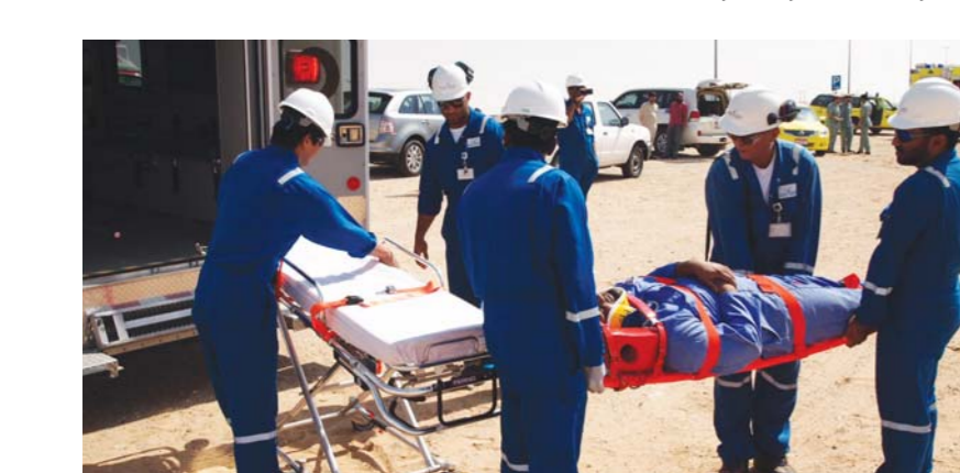
موظفو دولفين للطاقة يتأكدون من سير أعمال الحفر وبذلون الصعوبات

وقد جرى تصميم هذا التمرين لاختبار جاهزية إجراءات الاستجابة للطوارئ في الشركة ومدى فعاليتها، بالإضافة إلى وقت الاستجابة الذي تستغرقه سيارات الإسعاف وفريق الطفاء والإفقاد في الدفاع المدني للوصول إلى مكان الحادث، وقد نفذ الموظون المشاركون وقائع التمرين بدرجة عالية من المهنية مما ساهم في نجاحه تماماً. ويعود الفضل في نجاح التمرين إلى التعاون الوثيق والجهود المشتركة بين قسم عمليات الإمارات في دولفين للطاقة والدفاع المدني وخدمات الإسعاف بالعين. كما أظهرت نتائج هذا التمرين حرص الأطراف الثلاثة المشاركة فيه والسلطات المحلية