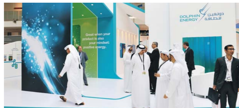
Dolphin Energy's stand had a strong presence during the exhibition

Looking forward to next year, Mohammad Sahoo Al Suwaidi, Gas Director of ADNOC and Chairman of ADIPEC 2013 commented, "The global energy mix is diversifying to include both hydrocarbons and alternative sources such as renewables to meet growing energy demand and reduce carbon emissions. Natural gas is therefore assuming greater prominence as an energy source and the conference program next year will bring these developments into clearer focus." ■