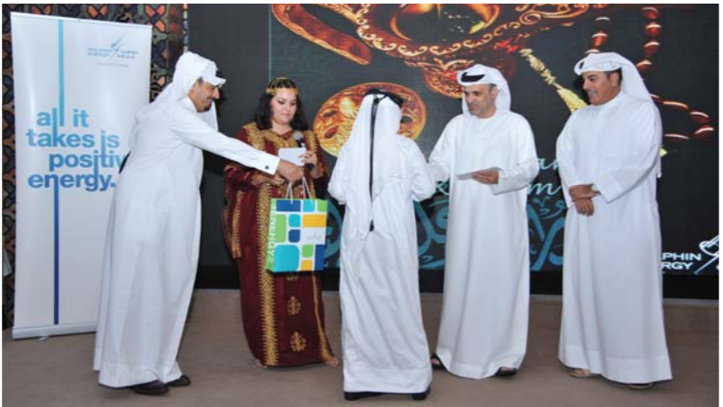
أحد الفائزين يستلم جائزته

وفي وقت سابق من شهر رمضان قدمت إدارة العلاقات العامة والشركة بالتعاون مع شركة دولفين للطاقة في هذا المعرض بمنصة عرض أقامتها في جناح الطاقة والصناعة وذلك تأكيداً على التزامها بالتبعية لحماية البيئة. وقد عرضت الشركة في منصتها على أهم الإنجازات والمبادرات الجديدة والمعايير التي أطلقتها إدارة الجودة والصحة والسلامة والبيئة والأمن في عملياتها البيئية والتي اشتملت على إدارة الانبعاثات الغازية، وترشيد استهلاك الطاقة، وخفض احتراق الغاز وانبعاثات الغازات الدفيئة