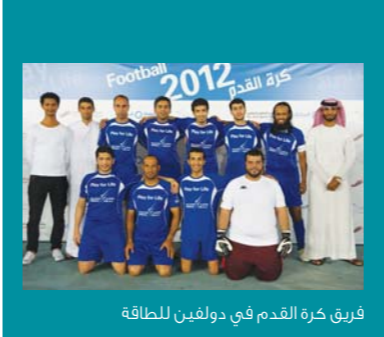
فريق كرة القدم في دولفين للطاقة

في ختام البطولة، تأهل للدور النهائي كل من منتخب شركة أبوظبي لتكرير النفط ومنتخب شركة أبوظبي للخدمات الصحية وبعد خروجه من التصفيات، بدأ منتخب دولفين للطاقة تدريباته استعداداً للفرز بالبطولة القادمة في ٢٠١٣ ■