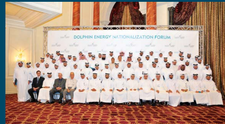
Dolphin Energy's Nationalization Forum in Doha