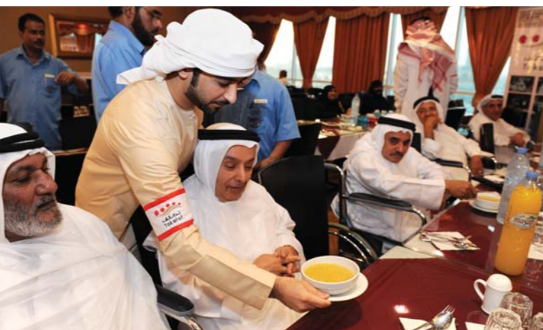
Dolphin Energy's Suhoor Donation helped people less fortunate in the Northern Emirates