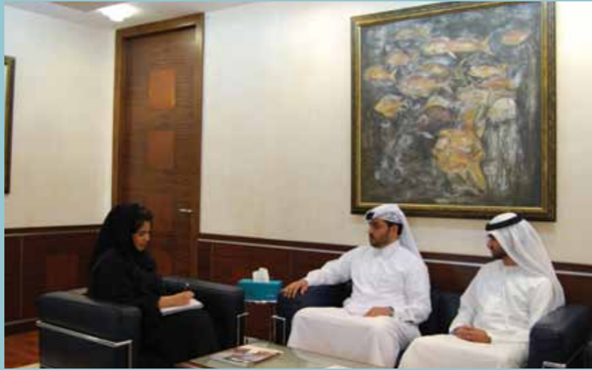
Dolphinsight catches up with members of the Internal Audit team

One of our main objectives is to provide independent assessments of the 'as is' situation and introduce new ideas and