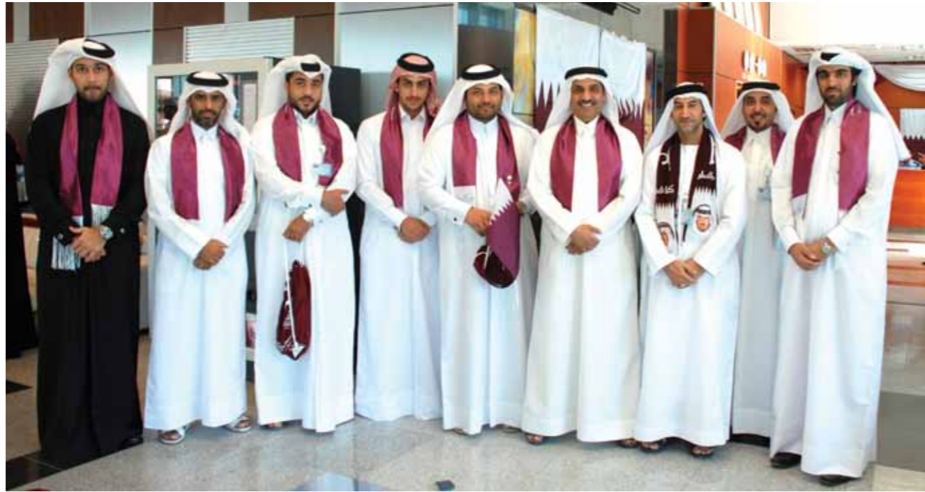
Members of Dolphin Energy Qatar celebrate National Day

Specially decorated cakes in Qatar's national colours were handed out and national songs were played until lunchtime. ■