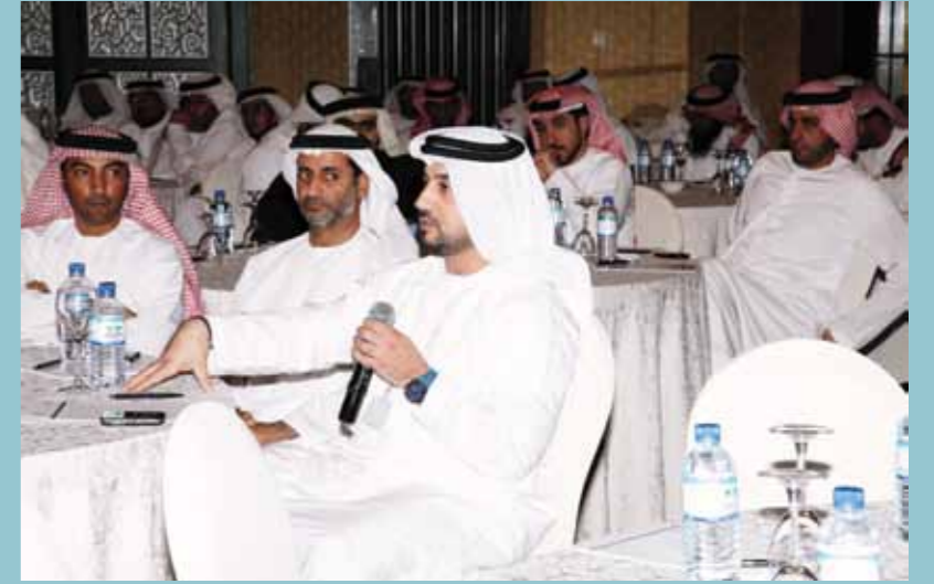
The Nationals Forum was a good platform for the company's Emirati employees to meet and raise their questions and queries to the senior management team