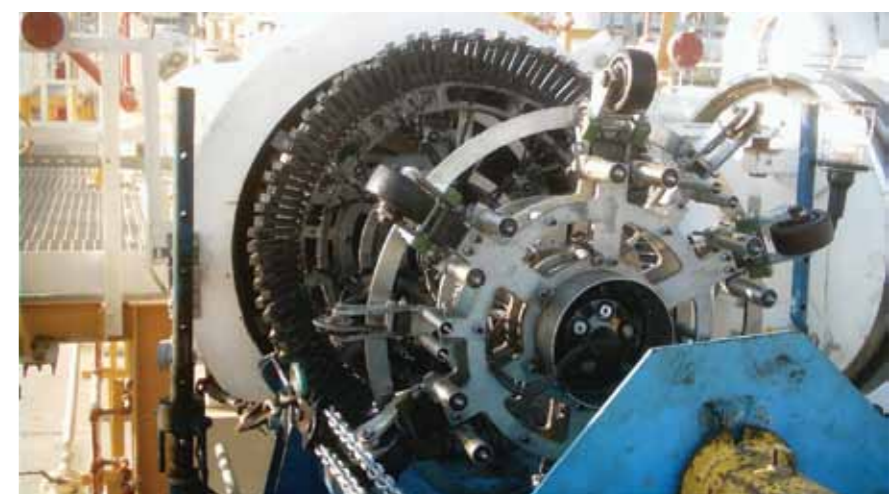
General Electric developed the inspection tool which is pictured above

The presentation generated much debate and discussion and was well received by those delegates in attendance. It helped to demonstrate how intelligent pigging supports business objectives and helps to maintain uninterrupted gas production. ■