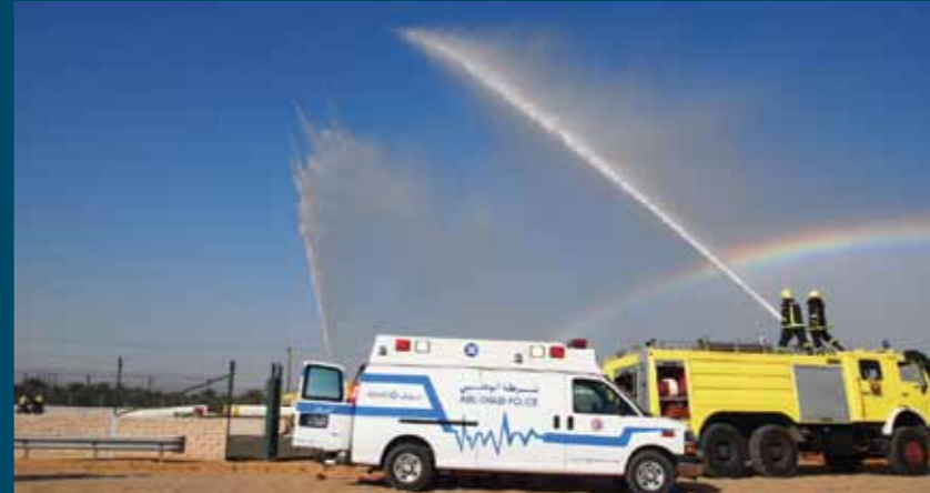
تدريبات مكثفة على حالات الطوارئ، في مناطق متفرقة من شبكة غاز الإمارات

جدير بالذكر، أن شركة دولفين سبق لها أن أجرت سبعة تدريبات على حالات الطوارئ في مناطق متفرقة من شبكة غاز الإمارات خلال العام المنصرم. 2011