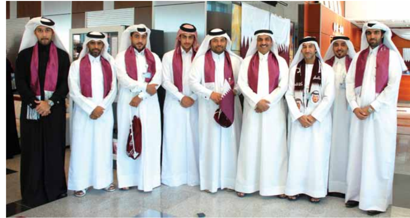
موظفو دولفين للطاقة في دولة قطر يحتفلون باليوم الوطني