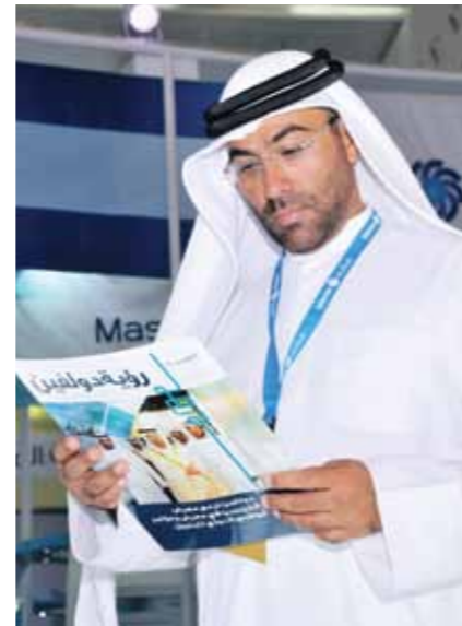
Our CEO reads a copy of Dolphinsight