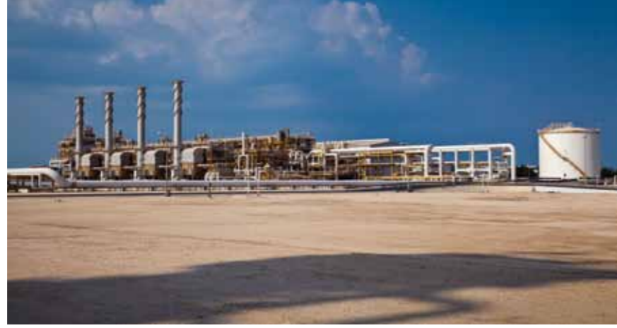
Our Gas Processing Plant at Ras Laffan