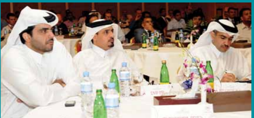
مثل الاجتماع السنوي الرابع للمقاولين، الفرصة المناسبة للتأكيد على التزام دولفين بأعلى معايير الصحة والسلامة والبيئة في جميع أعمالها

والشركات المقاولات التي فازت بالجوائز التقديرية هي: شركة تايكو للإضاءة والأمن بقطر، وشركة قطر للهندسة والإنشاءات، وشركة الخدمات البحرية، وشركة أنظمة أنابيب جي آر بي، وشركة بريمر لخدمات الكبريت، وشركة تيسير للخدمات، وشركة ديسكون بقطر، وشركة المانع الهندسية، وشركة النجم