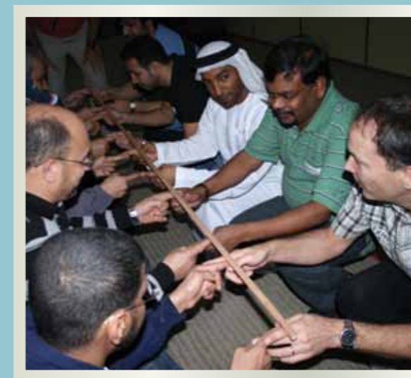
الخريجين الجدد مع مديريهم والمشرفين عليهم أثناء قيامهم ببعض الأنشطة العملية

في السابع عشر من شهر فبراير الماضي، نظم قسم التوظيف في دولة الإمارات العربية المتحدة ورشة عمل لتطوير قدرات الخريجين الجدد. وبأتي تنظيم هذه الورشة بالتوافق مع الالتزام المتواصل لشركة دولفين للطاقة (المحدودة) بتدريب وتطوير قدرات العاملين لديها.