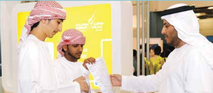
لاقت مشاركة دولفين بمعرض توظيف، كل القبول والترحيب من قبل المشاركين والزوار حيث تلقت دولفين أكثر من ألفي سيرة ذاتية لشباب إماراتيين باحثين عن وظائف مناسبة

موظف إماراتي للالتقاء مع بعضهم البعض والتفاعل مع زملائهم ومع أعضاء فريق الإدارة العليا للشركة.