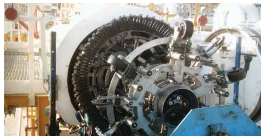
قامت شركة جنرال إلكتريك بتصنع آلة الفحص الموضحة بالصورة أعلاه

وقد ركزت هذه الورقة على الأسباب العملية الإيجابية وراء استخدام معدات كشط محددة لفحص خطوط