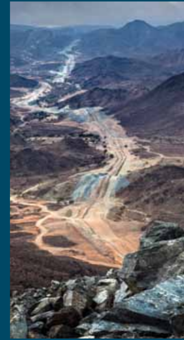
The mountain route section of TFP