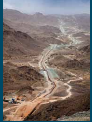
جزء من المسار الجبلي لخط أنابيب الطويلة - الفجيرة

تهانينا لجميع من ساهم في تحقيق هذا الإنجاز. ■