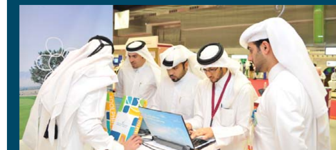
تقديم السيرة الذاتية للراغبين بالعمل في الشركة عبر الإنترنت