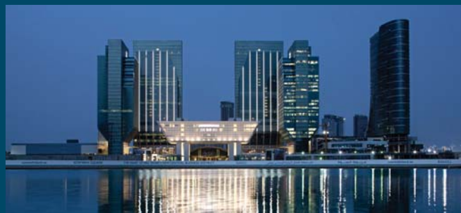
Sowwah Square – the heart of Abu Dhabi's new Central Business District (CBD)