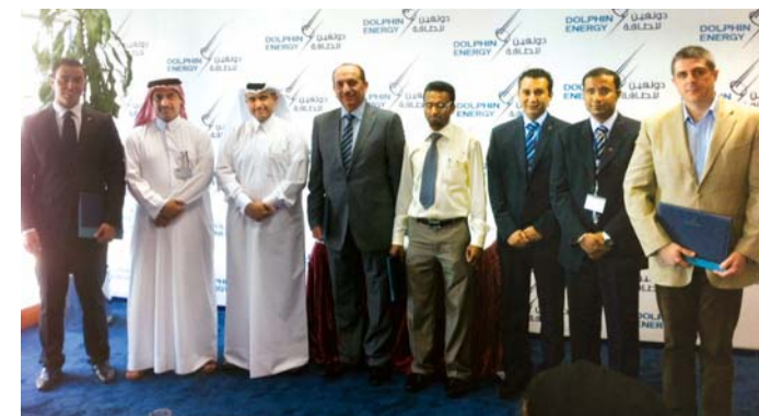
Members of Dolphin Energy and vendors participated at the Award Ceremony