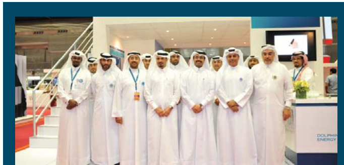
HE Al-Sada, Minister of Energy & Industry with Dolphin Energy Senior Management