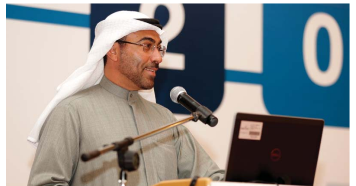
الرئيس التنفيذي أحمد علي الصايغ يلقي كلمته الافتتاحية