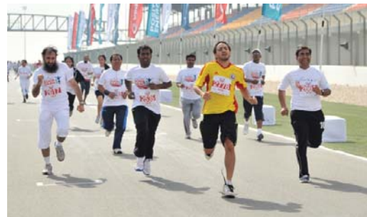
Participants demonstrating their fitness at the race