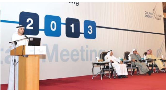
The CEO Meeting Panel listening to Obaid Al Dhaheri's presentation