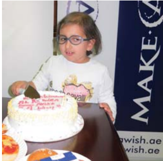
الحورة تقطع حلوى «تحقيق أمنية» احتفالاً بالحصول على أمنيتها