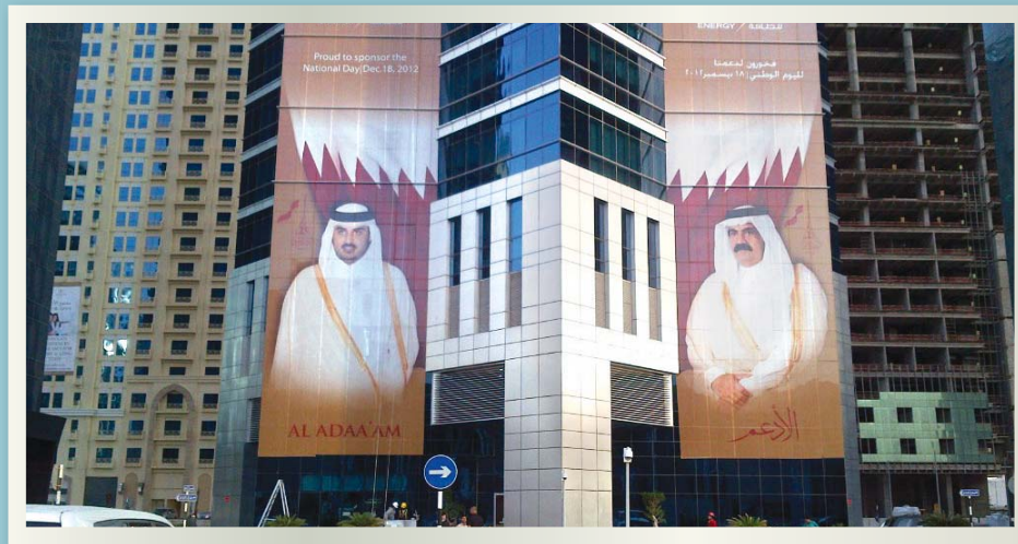
Dolphin Energy Tower in celebration of Qatar National Day

The celebration of Qatar's National Day was felt across the country with a wide range of activities taking place nationwide including fireworks, cultural programs and a celebration of historic events. ■