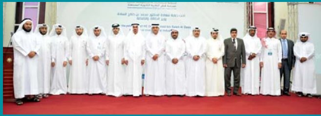
مشاركة دولفين للطاقة في اليوم المهني لمدرسة التقنية الصناعية