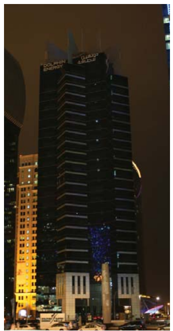
برج دولفين للطاقة بعد إطفاء الأنوار

وقد تم التقاط بعض الصور لبرج الشركة قبل وأثناء الفعالية تم تسجيل قراءة عداد البرج لمعرفة كمية الطاقة التي تم توفيرها وهي بمقدار ٣٣٣ وحدة. ■