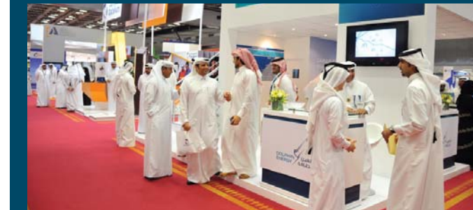
اهتمام الشباب القطري بزيارة جناح دولفين للطاقة