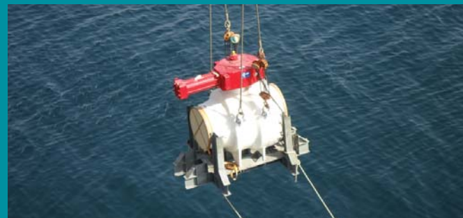
رافعة من سفن الإمداد البحرية ترفع الصمام من القارب لنقله لاحقاً إلى المنصة

تيسر إدارة العقود والمشتريات، وبالتعاون مع قسم تخطيط موارد المشاريع، أن تعلن عن إطلاق بوابة جديدة للتسجيل إلكترونياً وبند العمل فيها على الموقع الرسمي لشركة دولفين للطاقة تعتبر هذه البوابة نظاماً إلكترونياً على شبكة الإنترنت مخصصة لتسجيل بيانات جميع شركات الموزعين المتعاملين مع دولفين للطاقة في كل من دولة الإمارات ودولة قطر بهدف إعداد دليل تجاري، كما ستكون إدارة العقود والمشتريات هي المسؤولة عن هذا الدليل والبوابة الإلكترونية أيضاً. وتلقت دولفين للطاقة غياة السادة الموزعين إلى أن التسجيل في هذه البوابة لا يُعدّ تالياً مسبقاً لشركاتهم.