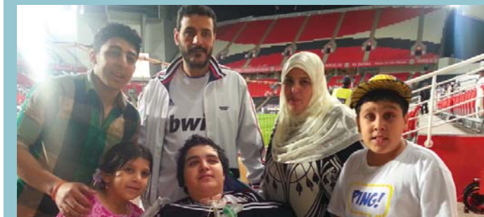
ضيفنا المميز مع أفراد أسرته خلال حضور مباراة في نادي الجزيرة من أجل حضور المباراة. ■