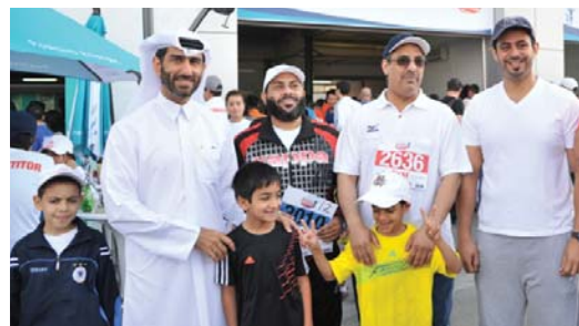
يستمتع المشاركون بسباق الدوحة للمسافات القصيرة