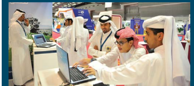
Qatari Youth showing great interest while submitting their CVs online