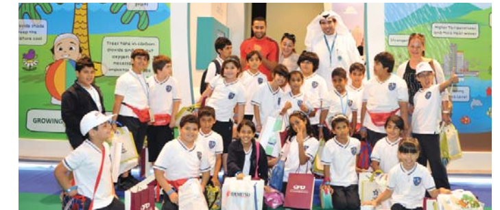
A school visiting Dolphin Energy Booth at the Fair celebration of the Environment Fair

To further promote its commitment to Qatar National Vision 2030, Dolphin Energy participated in the fourth Qatar Petroleum Annual Environment Fair. The fair took place at the Doha Exhibition Centre on 14 to 16 April 2013, and was held under the patronage of His Excellency Dr. Mohammed bin Saleh Al Sada, Minister of Energy and Industry.