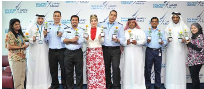
توزيع شتلات لموظفي دولفين للطاقة بمناسبة معرض البيئة

واختتم السيد البوعيين كلمة قائلاً: «اضطعت دولفين للطاقة بكامل مسؤولياتها البيئية بطريقة جديّة بوصفها إحدى كبرى شركات الطاقة حيث نجحت بين عاقي ٢٠١٢ و ٢٠١٣ في الحد من مستوى احتراق الغازات لديها بنسبة ٧٨٪، وانبعاثات الغازات الدفيئة بنسبة ٢٤٪».