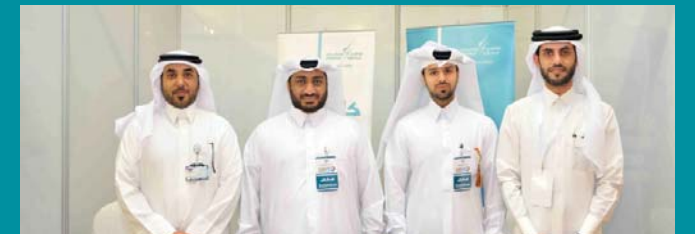
Dolphin Energy's stand at the QITS Career day