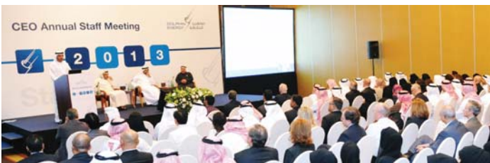
الموظفين أثناء اجتماع اللقاء السنوي للموظفين مع الرئيس التنفيذي