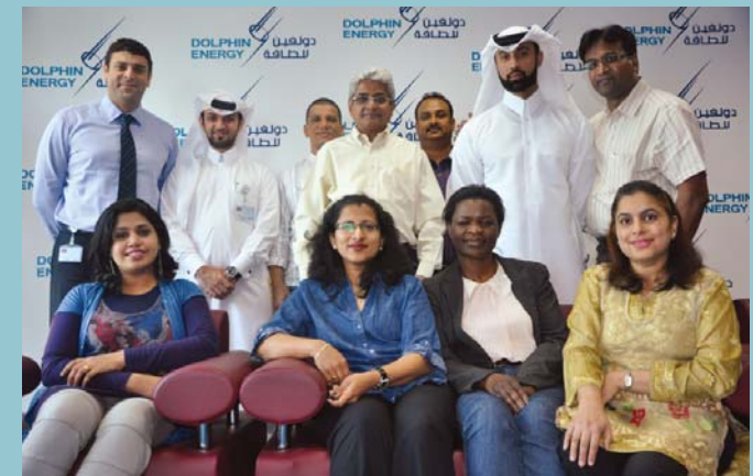
صور جماعية لفريق قسم المالية في قطر