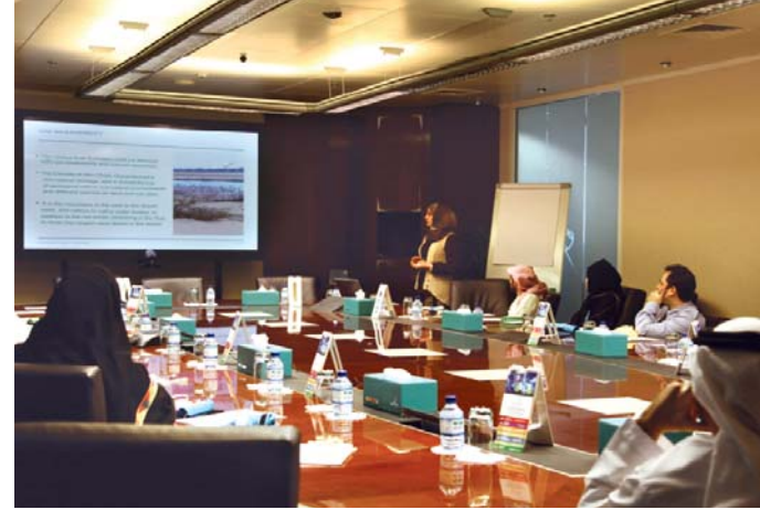
موظفي دولفين للطاقة خلال العرض المقدم بمناسبة يوم البيئة الوطني لدولة الإمارات

أقمت الشركة دورات تدريبية بالتعاون مع مدبر الحملة في هيئة البيئة في أبوظبي، محاضرة أوضحت من خلالها للموظفين أن البيئة الصحراوية في دولة الإمارات ذات طبيعة حيوية وغنية بمختلف أنواع الحيوانات والطيور والحشرات والنباتات التي تحتاج إلى الحماية.