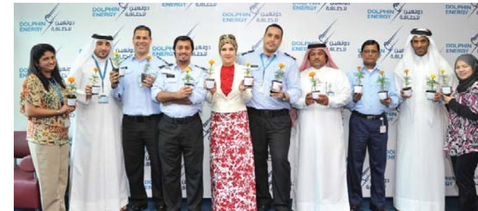
Seedlings distributed to Dolphin Energy Employees in celebration of the Environment Fair