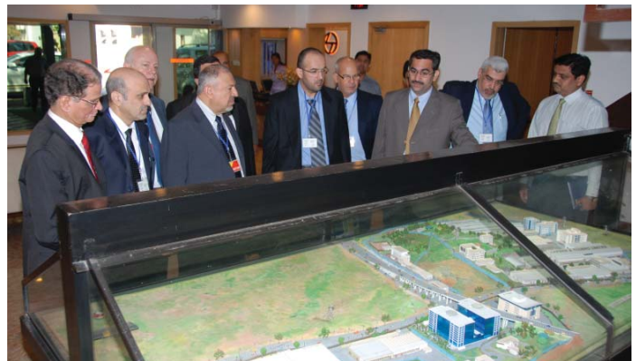
زيارة أعضاء من الإدارة العليا من دولفين للطاقة لمرافق لارسن وتوبرو

صنفت مجلة فوربس شركة لارسن وتوبرو التي تأسست عام ١٩٣٨ في المرتبة التاسعة في قائمة الشركات العالمية الأكثر إبداعاً وابتكاراً متقدمة بذلك على غوغل وأبل ماكنتوش. وكانت دولفين للطاقة قد أرست في نوفمبر ٢٠١٢ عقد الهندسة