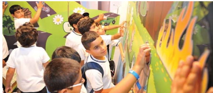
مشاركة واسعة من أطفال المدارس خلال المعرض

هذه الفعاليات بقوله: «تلتزم دولفين للطاقة بشكل وثيق بتنفيذ كافة أعمالها بطريقة تحمي البيئة، حيث أننا نعمل بشكل وثيق مع شركائنا لمعالجة المخاطر البيئية وإدارتها بفعالية، مع التركيز المستمر على التميز في العمليات التشغيلية».