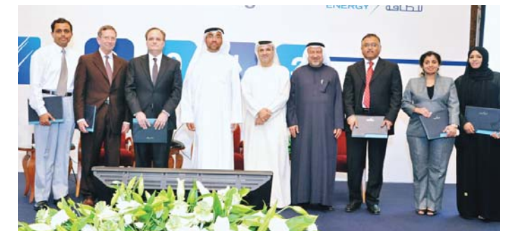
A Unique Contribution Award presented for Project Financing 2012