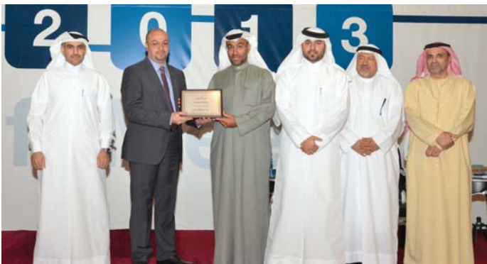
IT Disaster Recovery Team receiving a Recognition Award