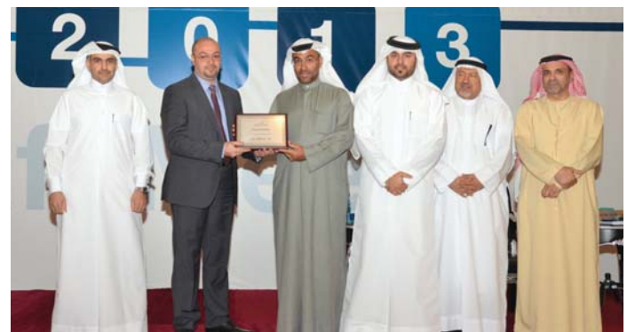
فريق استمرارية العمل في تكنولوجيا المعلومات يحصل على جائزة التميز