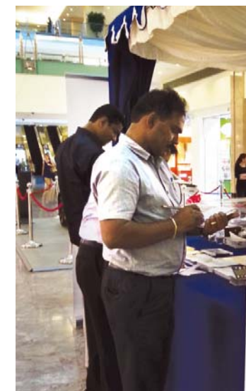
زوار جناح دولفين للطاقة بمناسبة أسبوع المرور الخليجي

انطلاقاً من التزامها بمسؤولياتها الاجتماعية، شاركت شركة دولفين للطاقة في أسبوع المرور الخليجي الذي جرى في النصف الأول من شهر مارس، وفي هذه المناسبة، شكلت الشركة لجنتين للسلامة في الطرق من أجل رفع مستوى الوعي بين موظفي الشركة خاصة بالنسبة للذين يعملون في الغالب على الطرق مثل السائقين بهدف التقليل من عدد الحوادث المرورية التي أصبحت تشكل مصدر قلق وخطر كبيرين. كما قامت المجموعة الإماراتية في العمل على سلامة الطرق في دولفين للطاقة وبالتعاون مع مديرية شرطة أبوظبي والدوريات بنصب خيمة في مركز أبوظبي للتسوق حيث جرى توزيع المنشورات التي تتناول عدداً من مسائل السلامة المرورية على زوار المركز وتحت شعار "سلامتك هدفنا" جرت في الخيمة التوعوية مسابقة عن السلامة في الطرق شارك فيها زوار المركز، حيث حصل أصحاب الإجابات الصحيحة على جوائز قيمة وهي عبارة عن قسائم مشتريات من محلات مركز أبوظبي للتسوق. كما نظمت مسابقات مماثلة لموظفي شركة دولفين للطاقة، فقد ظُلب منهم البحث عن الأسئلة في كتيب سلامة الطرق المنشور على الموقع الإلكتروني للشركة. كما شاركت دولفين للطاقة في دولة قطر أيضاً في فعاليات أسبوع المرور الذي نظّمته وزارة الداخلية القطرية. ■