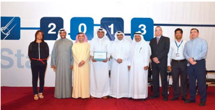
HSE Team Receiving a 'Unique Contribution' Award in 2012

The floor was then open for questions and answers followed by a dinner. It was a proud day for Dolphin Energy to recognize employees for the Honored Service Awards for completing 5 & 10 years of service, as well as the Unique Contributions and significant contributions to HSE. See the names of these employees in the special insert of the newsletter. ■