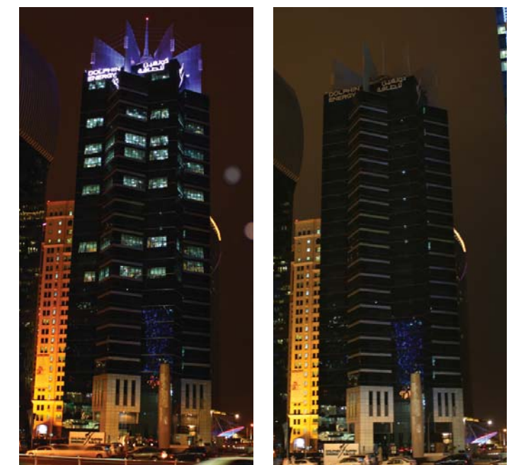
The Dolphin Energy Tower before switching off the lights The Dolphin Energy Tower after switching off the lights

In the lead up to the event, an email and SMS were sent to all Qatar based employees encouraging them and their families to participate in Earth Hour by reducing electrical usage in their homes and turning off all unnecessary lights. As well, employees were encouraged to shutdown their computers before leaving for the weekend. Photos of Dolphin Energy Tower were taken before and during the event and the meter reading of the tower was taken to check how much energy was saved (323 Units). ■