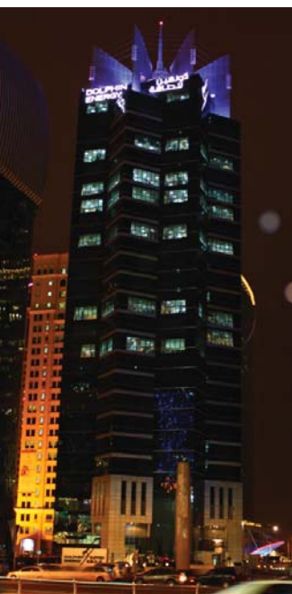
برج دولفين للطاقة قبل إطفاء الأنوار