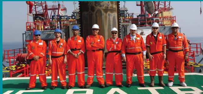
Dolphin Energy management visited DOL-2 prior to the Shutdown, to oversee everything and meet the team