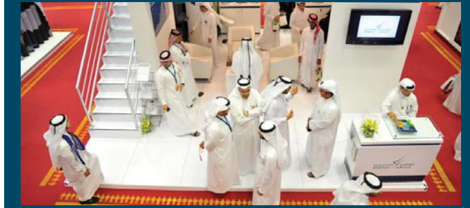
Dolphin Energy Booth at the Fair