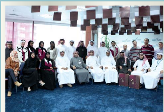
Dolphin Energy senior management members & employees celebrating Qatar National Day