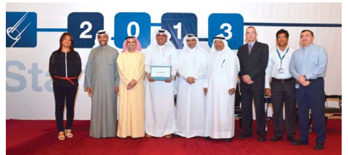
فريق الصحة والسلامة والبيئة يستلمون هدية تقديرية عن أدائهم المتميز في ٢٠١٢

وفي نهاية اللقاء، فتح المجال أمام الموظفين لطرح أسئلتهم واستفساراتهم مختتماً بدعوة الجميع لتناول طعام العشاء. ■