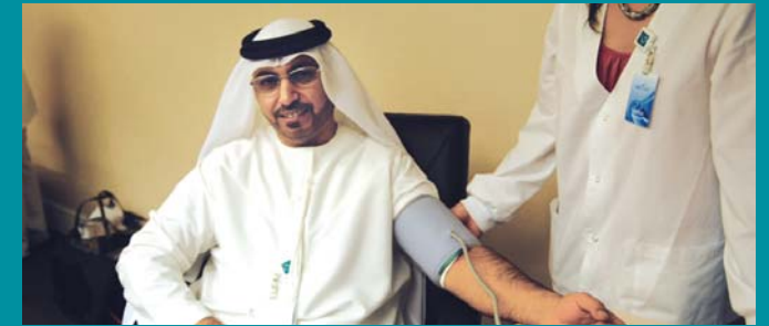
Dolphin Energy employees participate in the Wellness Campaign

Over 40 employees participated in the lecture and check up – each person left knowing the best way to stay fit within the scale of their weight and height. ■