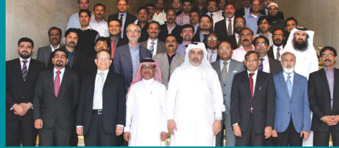
صورة جماعية التقطت بمناسبة انتهاء عملية إغلاق المنشآت لعام ٢٠١٣ والتي تحلّت بالنجاح