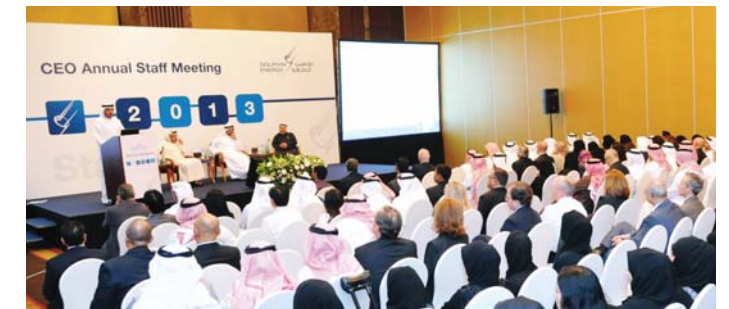
Employees attending the presentations at the CEO meeting