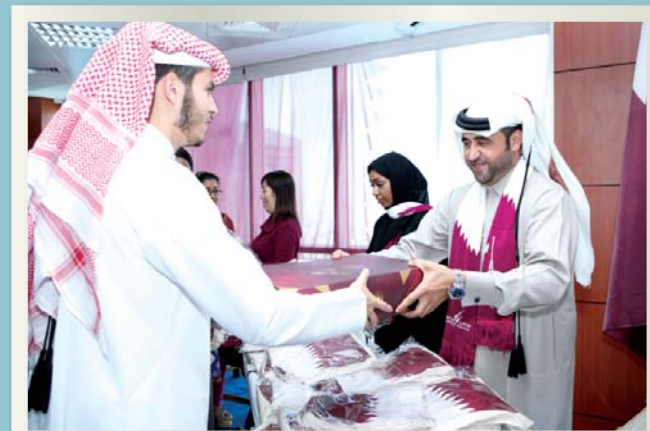
Dolphin Energy employees receiving gifts on the occasion