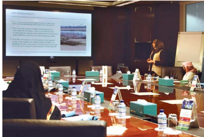
Dolphin Energy employees attending the UAE Environment Day presentation

The lecture also covered the effective role of strategic partners to make the UAE free of plastic bags, reminding staff about the need to use environmentally friendly bags to avoid leaking of toxic substances which contaminate soil and cause damage to the wildlife. The lecture ended with a Q&A session and each audience member received an environmentally friendly bag for shopping. ■