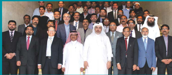
Group photo taken for the successful completion of 2013 shutdown

The main contractor for the job was Madina, who have been working with Dolphin Energy since 2012 on a three year contract. ■