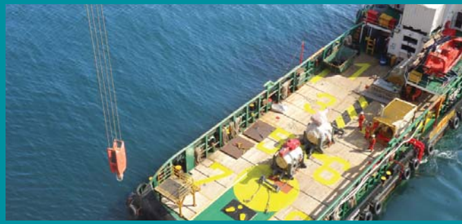
The Offshore Life Board (OSLB) crane lifting the valve from a boat for shifting later onto the platform