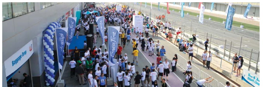
صورة جماعية للمشاركين في السباق والجمهور داخل منطقة الفعاليات

احتفالاً باليوم الرياضي الوطني لدولة قطر في ١٢ فبراير ٢٠١٣، شاركت دولفين للطاقة في سباق الدوحة للمسافات القصيرة كراعٍ رسمي للحدث الذي يقام لأول مرة في قطر، والذي جرت فعالياته في حلبة لوسيل الدولية، بمشاركة عدد كبير من الجمهور من مختلف الجنسيات والأعمار. إن الهدف من اليوم الرياضي الوطني في قطر هو تشجيع السكان في قطر على ممارسة الأنشطة الرياضية. لذا قررت شركة دولفين للطاقة المحدودة رعاية الافتتاح الرسمي لهذا الحدث الذي نُظم من قبل شركة مجموعة الرياضيين المحترفين.