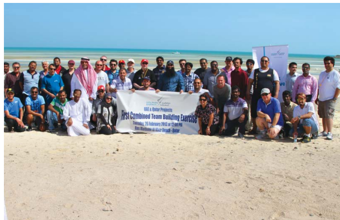
Dolphin Energy's project teams from both UAE & Qatar at the team building

At the end of the day, the team building exercise was a success as team spirit was at an apex and it was reinforced that the Project Division had shared goals and objectives. There was an overwhelming sense of bonding between all the team members and everyone left with a renewed sense of camaraderie. ■