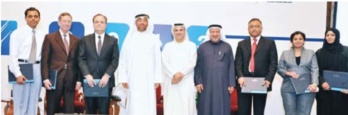
تسليم جائزة المساهمات المتميزة لتمويل مشروع سنة ٢٠١٢