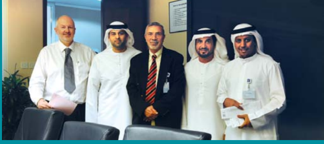
مشاركة موظفي دولفين للطاقة في حملة اليوم الصحي

شارك في المحاضرة والفحوصات الطبية أكثر من أربعين موظفاً تمكنوا خلالها من معرفة أفضل السبل للحفاظ على صحتهم ورشاقتهم ضمن نطاق الوزن والطول الخاص بكل منهم. ■