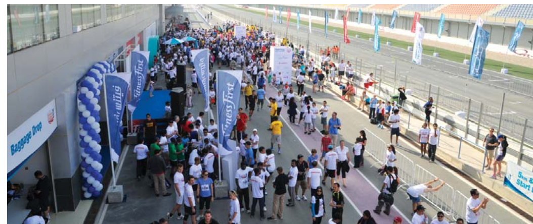
A view of the racetrack and event activities from the top