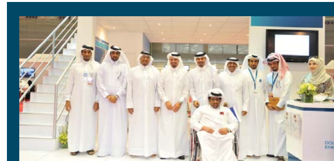
ضيوف دولفين للطاقة في جناح الشركة