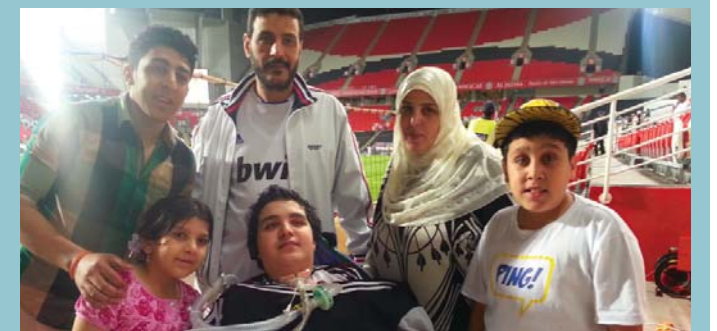
Our special guest with his family enjoying the Al Jazira Football match

Our guest commented, "I am so happy to have the opportunity to go and watch a football match with my family and friends. We had a lot of fun together! This event really helped lift my spirits as I have been in the LTVU since it first opened at Sheikh Khalifa Medical City. My family and I would like to express our gratitude to Dolphin for donating the tickets." ■