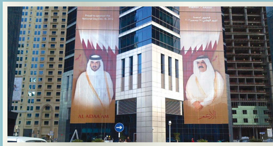
برج دولفين للطاقة في اليوم الوطني في قطر

احتفالاً باليوم الوطني لدولة قطر نظمت إدارة العلاقات العامة في شركة دولفين للطاقة احتفالاً أستم من الساعة ١١ صباحاً ولغاية ٢ بعد الظهر في ١٧ ديسمبر ٢٠١٢ في قاعة المناسبات في برج دولفين للطاقة. وقد صمم فريق العلاقات العامة ركناً مستوحاً من البيئة الثقافية والتراثية لدولة قطر وجرى توزيع الهدايا على جميع الموظفين احتفالاً بهذا اليوم التاريخي العام.