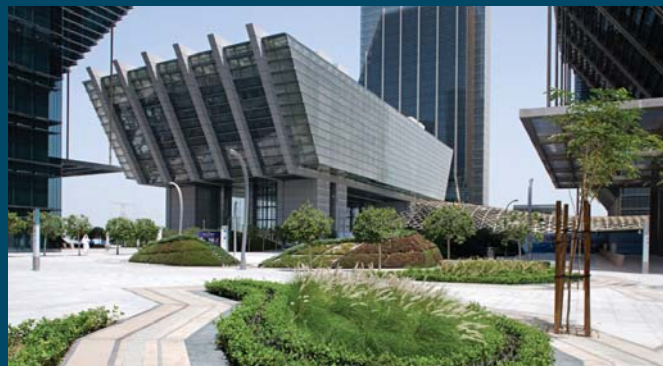
The iconic exchange building at the center of Sowwah Square