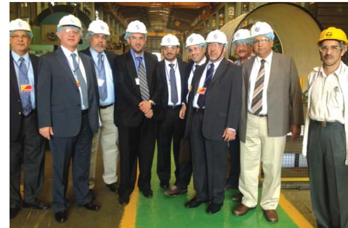
Members of Dolphin Energy senior management visit the facilities at Larsen & Toubro

In November 2012, Dolphin Energy announced the award of the EPC contract for its upgrade at its gas processing plant in Ras Laffan to L&T. The scope of work will include the detailed EPC of all necessary works to facilitate the installation of three new Rolls Royce Trent gas turbine compressors, each rated at 52 megawatts and related facilities. Once complete (expected for Q4 2014) the three new compressors will join six similar Rolls Royce compressors already servicing the plant. ■