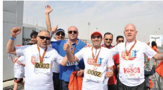
أعضاء من الإدارة العليا من دولفين للطاقة يحتفلون بالانتهاء من السباق