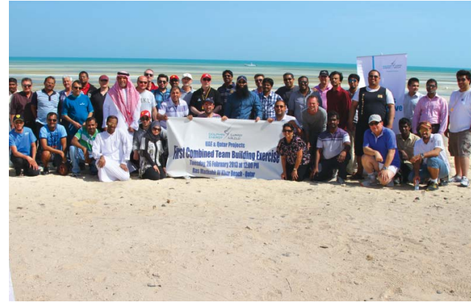
أعضاء فريق قسم المشاريع خلال حضورهم تدريب لبناء فريق العمل من قطر والإمارات