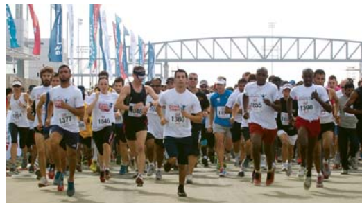
لحظة انطلاق العدائين في سباق الدوحة للمسافات القصيرة