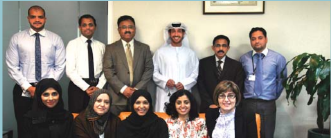
The UAE finance team gathers for a group shot