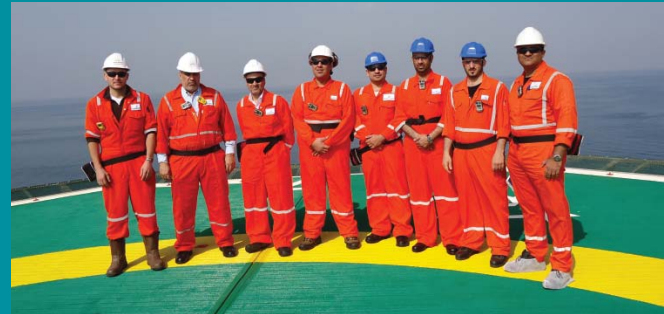
زيارة أفراد ادارة دولفين للطاقة DOL-٢ قبل الإغلاق للإشراف على الترتيبات والجمعيات بالفريق