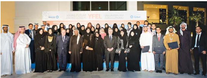
صورة جماعية لأعضاء ومشاركي برنامج القادة الشباب لطاقة المستقبل