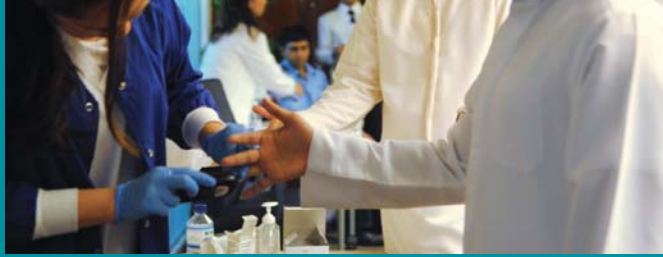
مشاركة موظفي دولفين للطاقة في حملة اليوم الصحي