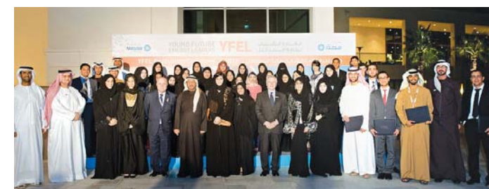
A group shot of the Young Future Energy Leaders

To find out more about the program please check the Masdar Institute website or speak with the Dolphin Energy HR team. ■