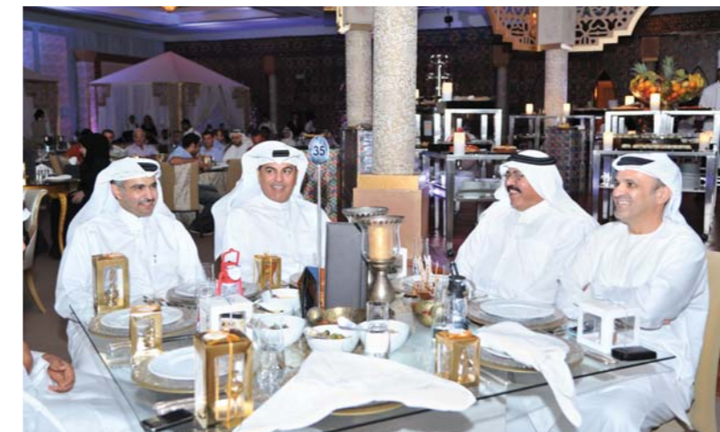
Dolphin Energy staff celebrating the festivities