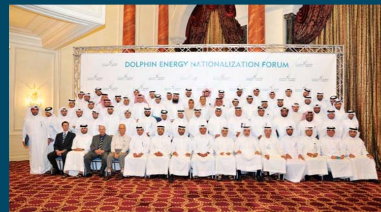
Dolphin Energy's Nationalization Forum in Doha