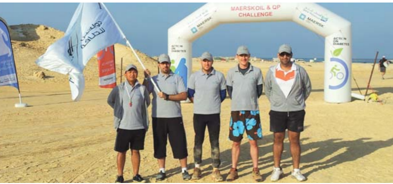
فريق دولفين للطاقة المشارك في المسابقة

وقد جرت وقائع المنافسة على أربع مراحل استغرقت يومين (١٧ و ١٨ نوفمبر) ضمن ظروف صحراوية قاسية، وتضمنت عدة مهمات صعبة منها وضع كل فريق في مكان مجهول في الصحراء والطلب منهم تحديد موقعهم وطريق الخروج باستخدام نظام تحديد الموقع العالمي