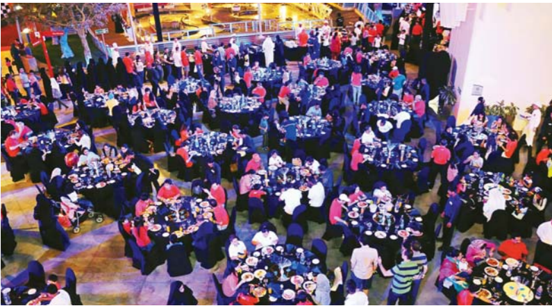
موظفو دولفين للطاقة مع أفراد عائلاتهم في أبوظبي يستمعون بفعاليات اليوم العائلي المبهر

وفي النهاية، غادر الجميع وقد أجمعوا على أنهم أمضوا أمسية ممتعة لا تنسى.