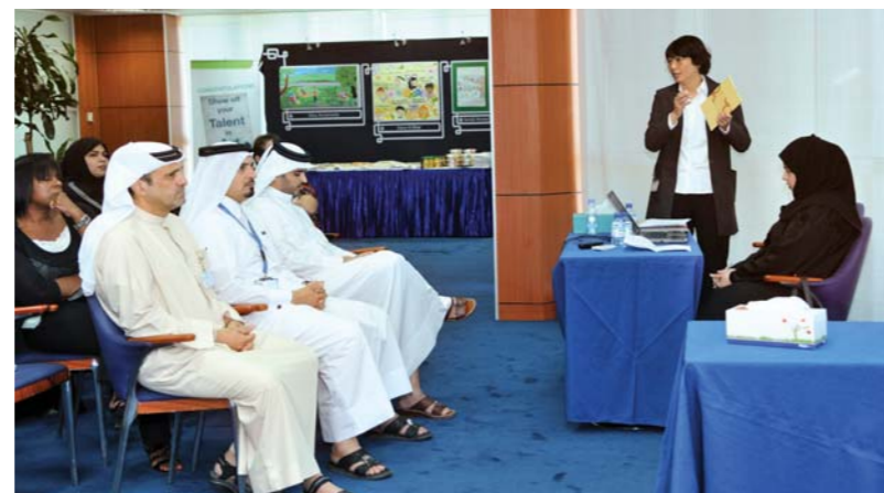
Dolphin Energy staff learn more about the Qatar National Vision 2030