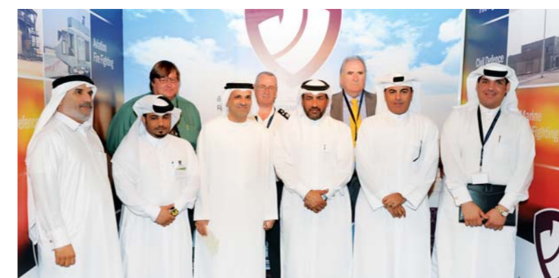
Members of Dolphin Energy visit a stand