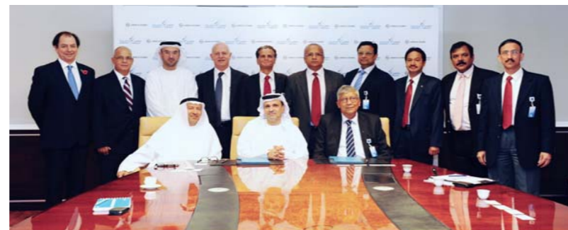
Senior Management of Dolphin Energy and Larsen & Toubro

Completion of the project is expected in the fourth quarter of 2014. ■