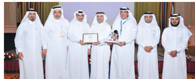
Dolphin Energy management proudly accept the award