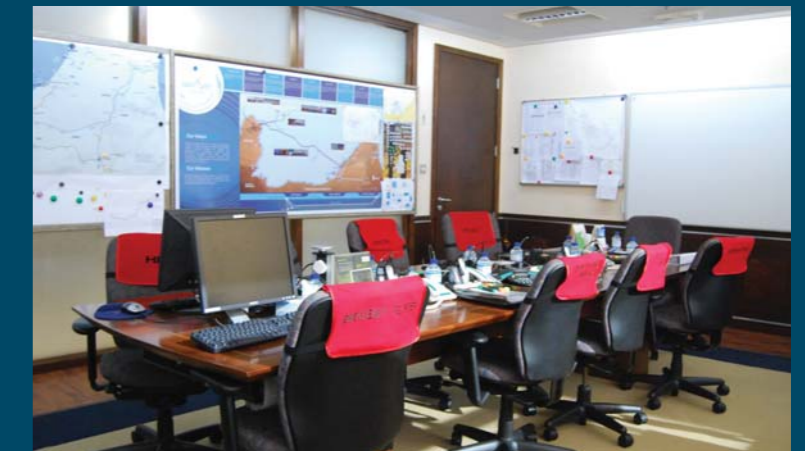
The Emergency Management Center (EMC) ready for any situation

Looking ahead to 2013, QHSE&S will focus on raising the profile of the Crisis and Emergency plans as well as conduct more localized exercises and refresher training to all essential personnel. It is paramount that our staff receives the most up-to-date training in line with the updated procedures. ■