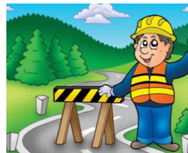
Safety is always a top priority at Dolphin Energy