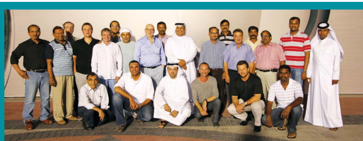
Dolphin Energy Projects Team in Qatar