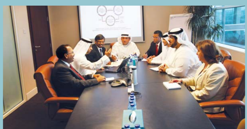
فريق التشغيل الآلي المؤسسي

هل يمكن إعطاؤنا أمثلة عن التأثير الإيجابي لعمل قسم التشغيل الآلي المؤسسي على شركة دولفين؟