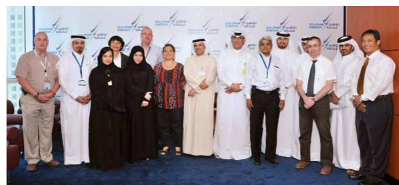
Dolphin Energy welcomes representatives from the General Secretariat for Development Planning

The purpose of the presentation was to learn more about QNV 2030 which aims to direct Qatar towards a balance between its development needs and the protection of its natural environment whether land, sea or air. The presentation also emphasized the importance of increasing citizens' awareness of their role in protecting the country's environment for their children and the nation's future generations. ■