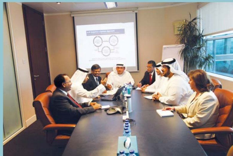
The Corporate Automation team