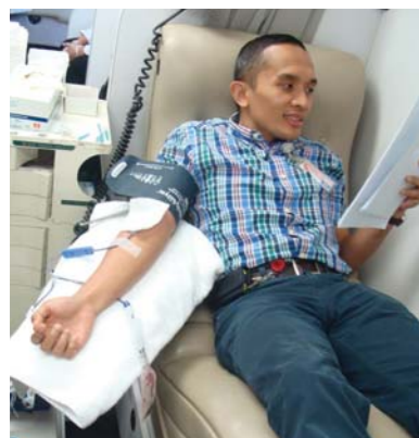
60 Dolphin Energy employees participated in the blood donation drive