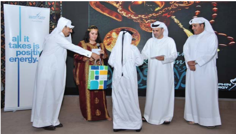
أحد الفائزين يستلم جائزته