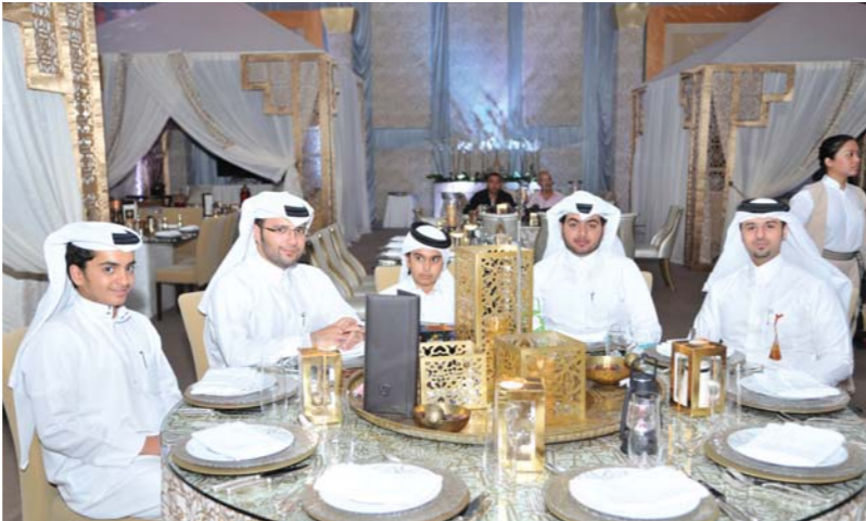
موظفو دولفين للطاقة يحتفلون بغبقة رمضانبة مميزة في قطر