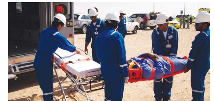
Dolphin Energy staff ensuring the drill goes smoothly

We look forward to assisting the Emirates Foundation further in 2013! ■