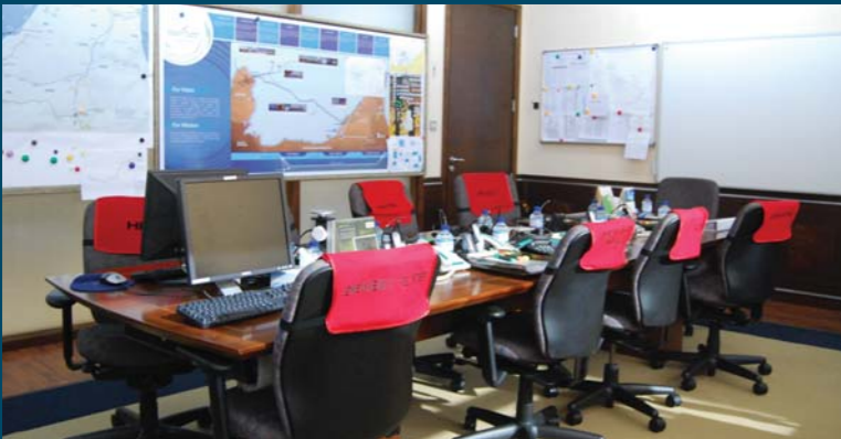
مركز إدارة الطوارئ في دولفين للطاقة مستعد دائماً للتعامل مع أي موقف

وبخصوص خططها لسنة ٢٠١٣، تنوي إدارة الجودة والصحة والسلامة والبيئة والأمن التركيز على تحديث خطط الكوارث والطوارئ وزيادة متطلباتها، وإجراء المزيد من التمارين المحلية والدورات التدريبية لتذكير كل الموظفين المعنيين بإجراءات الطوارئ. وتستند خطط الإدارة في هذا المجال على ضرورة توفير التدريب اللازم لجميع موظفي الشركة وفقاً لأحد إجراءات الطوارئ. ■