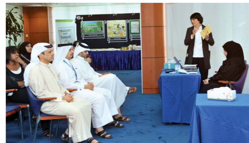
موظفو دولفين للطاقة يستمعون إلى عرض حول رؤية قطر الوطنية ٢٠٣٠