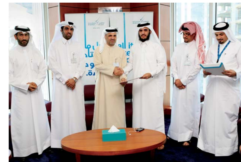
A summer Intern student receives certificate from Dolphin Energy Senior Managers