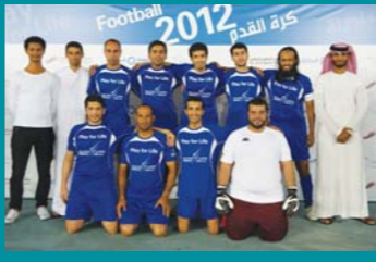
فريق كرة القدم في دولفين للطاقة

دولفين للطاقة x شركة الاتحاد للقطارات ٢ – ٣