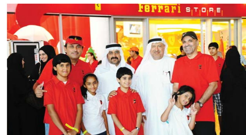
Children and adults both enjoyed the event