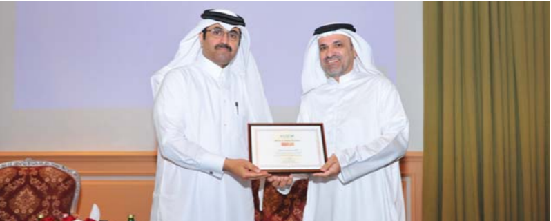
سعادة الدكتور محمد بن صالح السادة (إلى اليسار) وزير الطاقة والصناعة يقدم جائزة التميز والابتكار إلى السيد عادل البوعيين (إلى اليمين)

وتابع البوعيين قائلاً: "إن الفوز بهذه الجائزة لم يكن ممكناً لولا الجهد العظيم والتفاني الذي قدمه كل موظف في شركة دولفين للطاقة جنباً