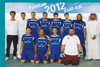
The Dolphin Energy Football Club

In the end, Takreer beat SEHA to claim the trophy for 2012. Dolphin Energy FC is already back on the pitch practicing, preparing to win it all in 2013! ■