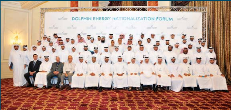
صورة جماعية للمشاركين في منتدى التوظيف السنوي لدولفين للطاقة بدولة قطر

وجرى خلال المنتدى توزيع الجوائز التقديرية على عدد من الموظفين القطريين نتيجة لأداثهم المتميز في عملهم خلال السنة الماضية، كما