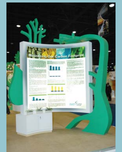
Dolphin Energy technical poster at Qatar Sustainability Expo 2012

The Technical Poster which was on display for the public at COP18 showcased the company's management approach towards a safe and clean environment. It was divided into six categories: Flaring Reduction, Energy Consumption, Climate Change and GHG Emissions, Gas Emissions, Green IT Initiative and Employee Engagement. ■