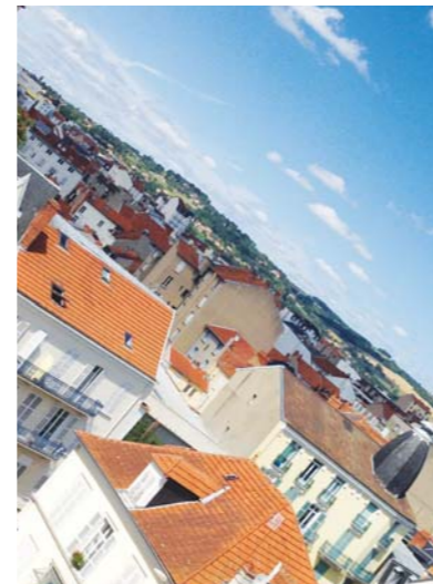
View from a classroom in Vichy