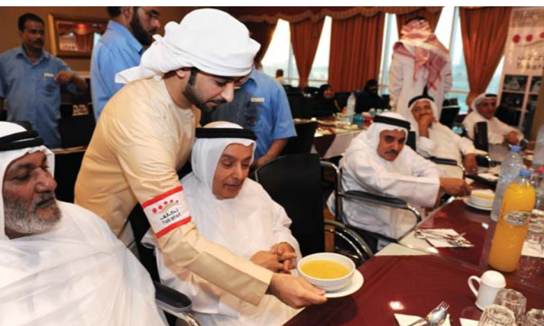
Dolphin Energy's Suhoor Donation helped people less fortunate in the Northern Emirates