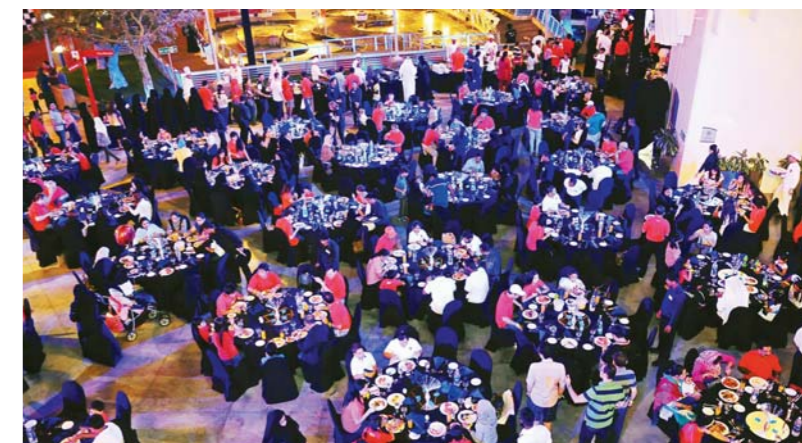
Dolphin Energy staff come together for dinner after a long day of activities and fun rides

included F1 Abu Dhabi Grand Prix tickets, gift certificates to the mall, iPad's, dinner and hotel vouchers as well as Etihad Airways flight vouchers. An amazing performance took place after the raffle combining gymnastics with theatrics, that left everyone mesmerized and excited for the rest of the evening. A large buffet dinner followed featuring a variety of international dishes before the park was closed to outside guests and Dolphin Energy employees had the theme park to themselves including the one of the world's fastest roller coasters, Formula Rossa – zero to 240 km/h in less than five seconds. Everyone agreed it was a night to remember! ■