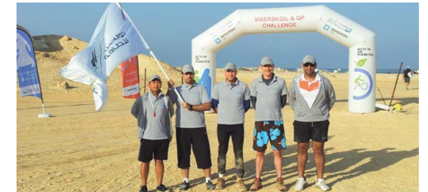
Dolphin Energy's team pushed themselves to the limit

All proceeds raised by participants of the challenge were donated to Qatar's Action on Diabetes partnership, thereby generating vital funds to support diabetes awareness, prevention and treatment programs. A cheque for US$100,000 was presented to the charity at the final ceremony of the challenge. ■