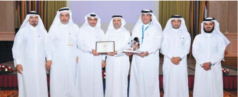
أعضاء الإدارة العليا في دولفين للطاقة تتسلم الجائزة بكل اعتزاز

إلى جنب مع شركائنا والمقاولين المتعاقدين معنا، ولذلك أود أن أتقدم بخالص التهنية إليهم جميعاً".