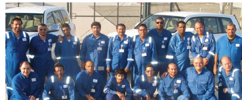
The Network Operations team in Taweelah

Third party encroachment is a major issue our team deals with. Many people are working near the pipeline unaware of the dangers present so we inform them and ask them to stop until the Technical Services department can issue them a NOC after doing some investigating. Another issue is the rough terrain our patrolmen have to deal with – large portions of our pipeline run through areas without proper roads so our team needs to have the skills to handle this type of driving. If you are curious - we all use Toyota Land Cruiser's for our monitoring. ■