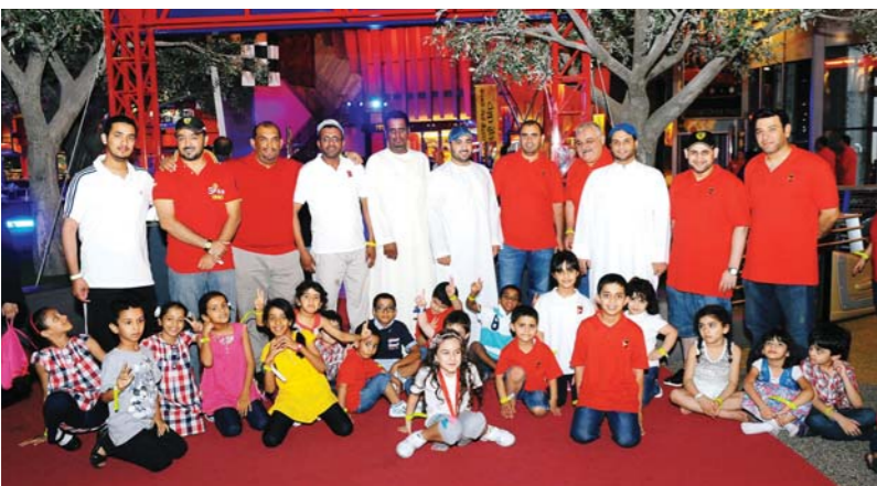
على الفرخ تجتمع أسرة دولفين للطاقة ولقاء مبهج بين الآباء والأمهات في اليوم العائلي